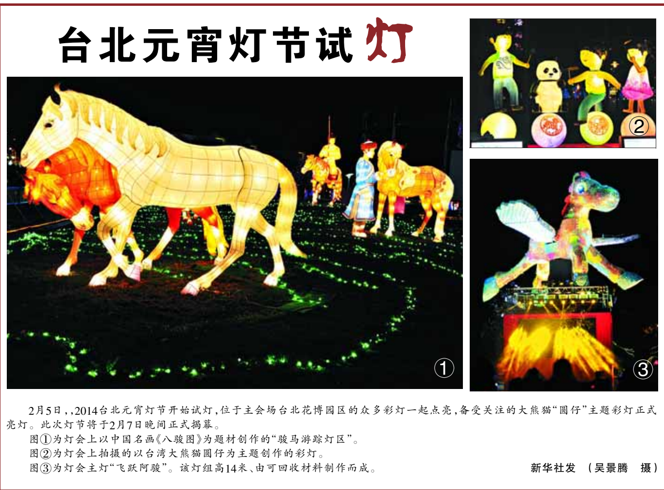
2月5日,2014台北元宵灯节开始试灯,位于主会场台北花博园区的众多彩灯一起点亮,备受关注的大熊猫“圆仔”主题彩灯正式亮灯。此次灯节将于2月7日晚间正式揭幕。

不少专家认为,此刻与其争议是否改名,不如尽快加强对活禽市场的规范管理。基层养殖户呼吁政府加大对种禽补贴及流动资金贷款利率贴息支持,帮助养殖户渡过难关。(据新华社北京2月6日电)