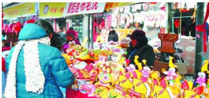
图为游客正在挑选万福虎。