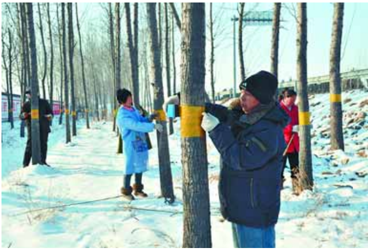
2月13日,护林人员正给京港澳高速公路沿线淇县北阳镇路段边的树木缠胶带,涂药。