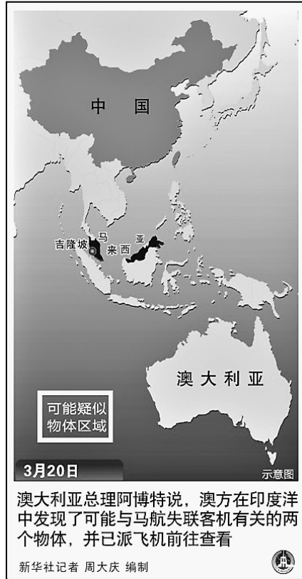
澳大利亚总理阿博特说,澳方在南印度洋中发现了可能与马航失联客机有关的两个物体,并已派飞机前往查看。新华社记者 周大庆 编制