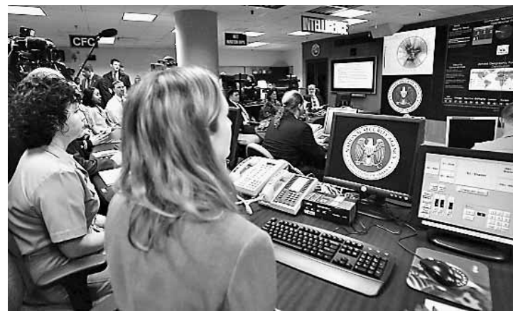
美国国家安全局反恐行动中心工作台(资料图)

美国媒体18日报道,美国国家安全局已建立一个电话监听系统,能记录“某个国家”100%的电话通话,并在通话发生后的一个月内回放所有通话记录。