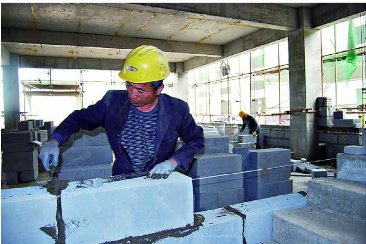
今年以来,浚县狠抓分包服务项目责任制,严格按照时间节点倒排工期,强力推进了一大批重点在建项目。图为4月10日,位于浚县产业集聚区年产18万吨蜂饮料项目建筑工地现场,工人们在加班加点砌墙体。