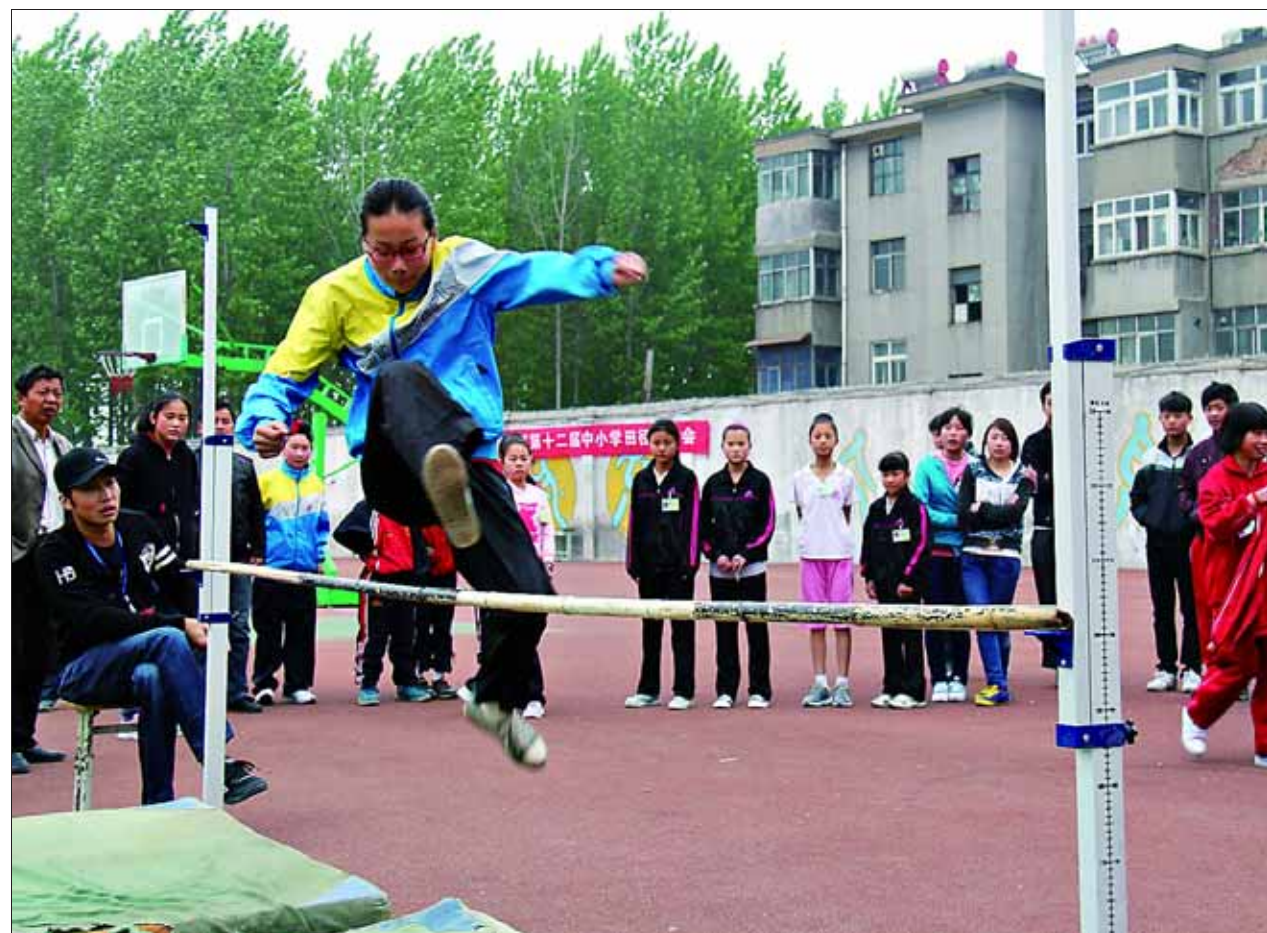
4月10日,鹤山区第十二届中小學生田径运动会在中山小学开幕。此次运动会为期两天,设有跳高、跳远、铅球、赛跑等田径项目。图为正在进行跳高比赛。刘长利 摄