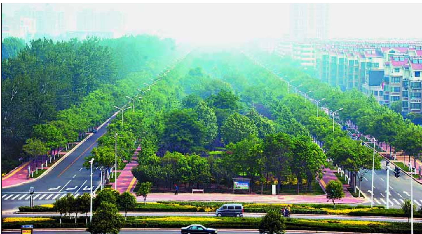
淇滨区华夏南路绿树成荫。