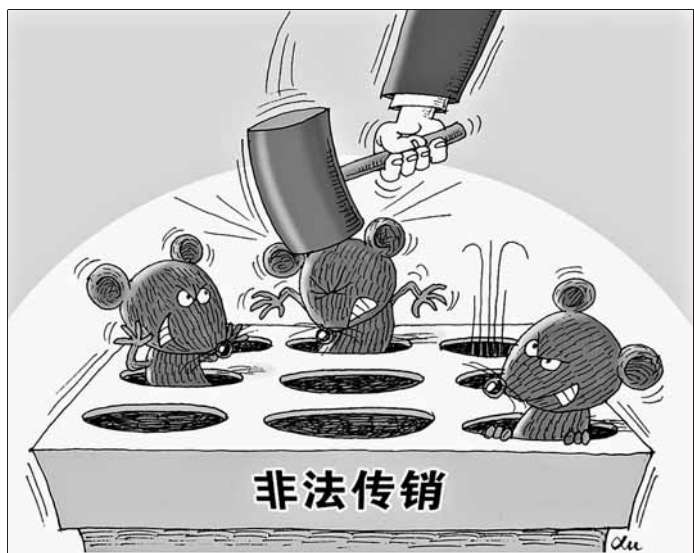
严打