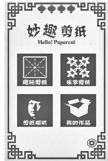
“妙趣剪纸”应用截图

目前,团队正根据用户意见对应用进行完善,提升趣味性和易用性。针对苹果系统的IOS版本应用也正在开发中,不久将会面世。