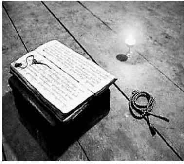
佛教传入后,佛教用语与汉语词汇有机结合,产生了众多新词汇。

我们经常说到的“世界”一词最初来源于佛教。佛法所说的世界,由时间和空间组成。“世”为迁流义,属于时间的范畴。佛法认为,时间像流水一样,处于不断迁流延续中,从过去延续到现在,再到未来,时间的存在形式为三世:即过去世、现在世、未来世。而“界”则是对于方位的界定,属于空间的范畴。佛教对于宇宙的空间,有六方和十方之说。六方指东、西、南、北、上、下;十方指东、西、南、北、东南、西南、东北、西北、上、下。