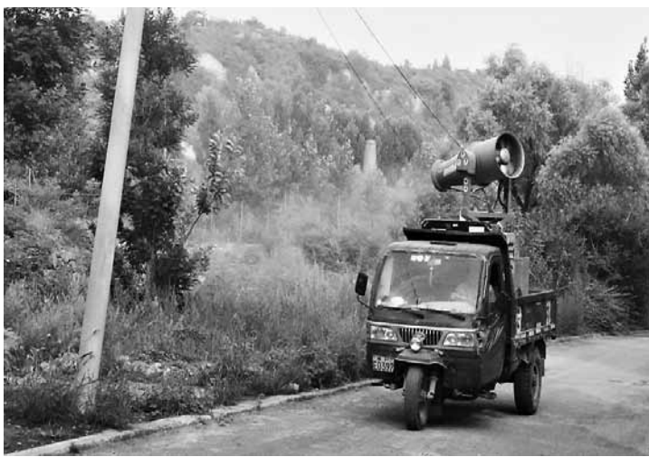
夏季是树木的生长旺季,然而以树木为食的各种害虫、病原物等也活动频繁起来,使树木遭受不同程度的危害。7月12日,有关部门在淇河湿地公园打药除虫。

据审查,被告人陈某某为郑州市惠济区人,与韩某为夫妻关系,陈某某为两人的儿子,张某某是陈某某的岳母。2011年6月至2013年6月,陈某某在郑州惠济区某村租赁的厂房、仓库内,生产冠以北京、四川等多家药业公司名称的伪劣兽药,并向其中的部分伪劣兽药中添加沙丁胺醇。其儿子陈某某积极参与生产伪劣兽药,妻子韩某也组织张某某等人以电话联系及网络销售方式向河南、山东等多个省份出售,涉案金额达56万余元。