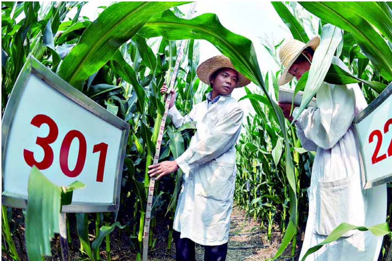
8月21日,市农科院的科技人员在夏玉米试验田里测量玉米株高。市农科院今年承担了20余项国家和省级试验项目。在科技人员的精心管理下,近400亩试验田里的玉米在大旱之年仍长势喜人。目前,该院已完成测配杂交组合上万个,完成2000多份玉米育种的投粉工作。

“享受免检的车辆,依然需要每两年申领一次年检标,并按规定贴在挡风玻璃上。”李晓高表示,实行新政策是为了更加科学化、人性化地对机动车辆进行管理,希望大家按照政策要求,对汽车进行检验,在享受政策优惠的同时,维护好我市的安全交通运输环境。