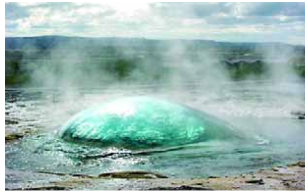
间歇泉:位于冰岛的间歇泉每间隔一段时间便喷发一次,鲜有人目睹其喷发瞬间。在间歇泉喷发前几分钟,水流会汇聚成一个大大的水泡。