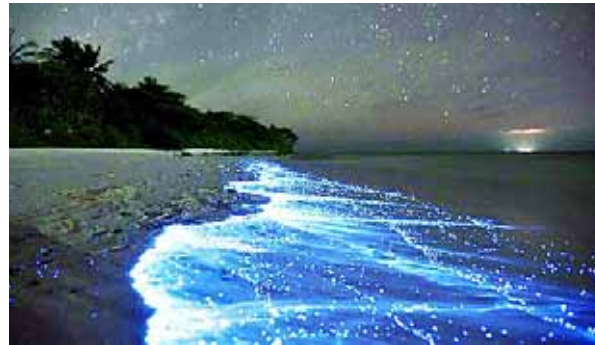
吉普斯兰湖:在马尔代夫海岸,有一个散发着蓝光的湖。这些蓝光是水中的浮游生物(比如海藻、水母)体内发生一种叫“生物荧光”的化学反应而产生的,海藻只要感受到海浪波动就会发出荧光。