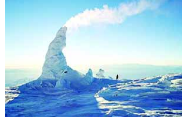
雪烟筒:在北极地区,热气冒出地底后瞬间结冰,于是在火山口附近便形成了大量雪烟筒,火山产生的蒸汽由此得以喷出来。