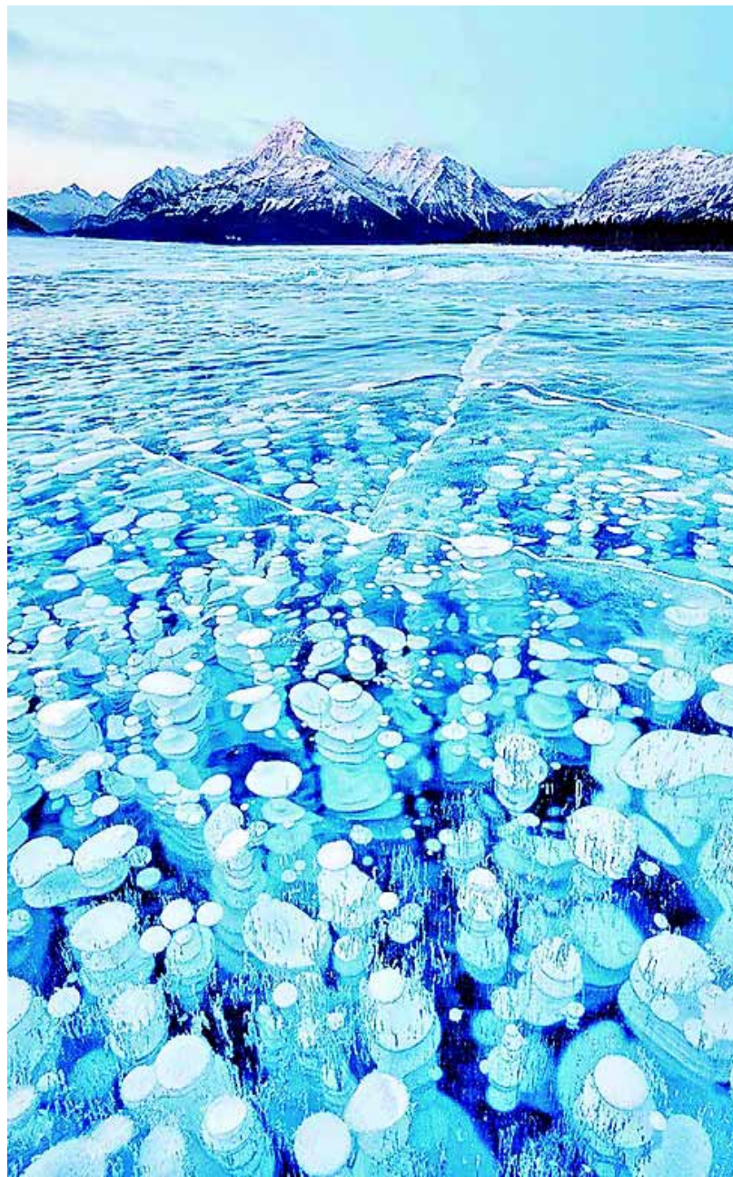
冰甲烷气泡:这一壮观美丽的自然景象是亚伯拉罕湖面以下的冷冻气泡,专家解释,死亡生物体在被细菌分解时会释放出甲烷,这些甲烷被困在冰块中,会产生大量气泡,从而造就了不一样的“冰雪世界”。