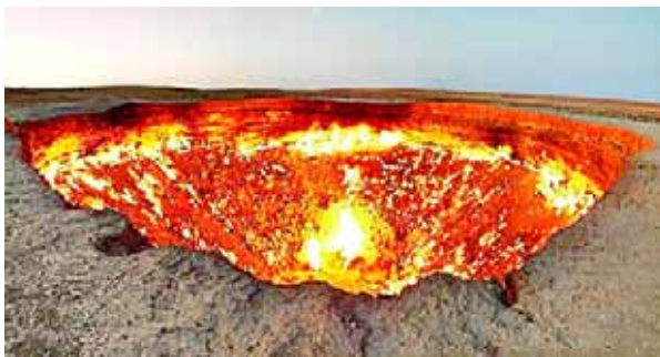
地狱之门:位于土库曼斯坦的地狱之门是一个剧烈燃烧的大火坑。因为其下面有天然气田,源源不断的天然气涌出被作为燃料,使得坑里的大火终日不灭。

大自然是最伟大的魔术师,它用鬼斧神工造就了自然界无数的奇观美景。下面就来看看自然界的“魔法”给人们带来的极致视觉享受吧。(据新华社)