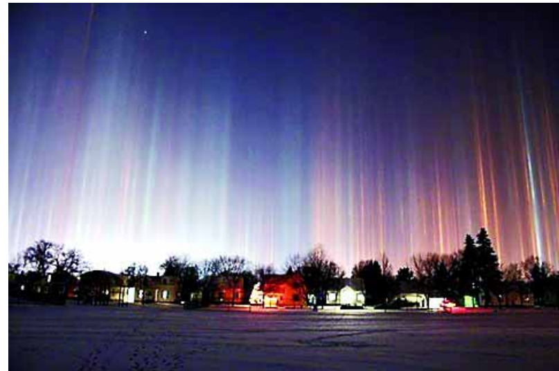
极光柱:这种现象只发生在零下20℃或更低温度的天气下。在无风的情况下,大气里的小冰晶便凝结成极光柱。

大自然是最伟大的魔术师,它用鬼斧神工造就了自然界无数的奇观美景。下面就来看看自然界的“魔法”给人们带来的极致视觉享受吧。(据新华社)