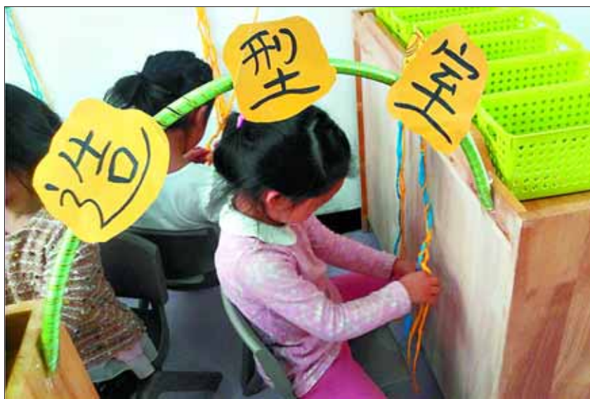
日前,淇县县直幼儿园进行区域活动创意评比,200余名幼儿参加了比赛。图为孩子们在创意室、造型室、建构区进行比赛。

本报讯 近日,笔者从淇县文联获悉,中国财富出版社出版了鹤壁市作家协会顾问、淇县作家协会名誉主席韩峰的散文集《旅途不寂寞》,此书被列入“传奇中国图书系列美文卷”。 该书收录了作者近百篇美文。作者以细腻的笔触、纯朴的语言,表达了对故乡和童年的怀念,对青春和爱情的赞美,对人文历史的见解以及对漫漫人生旅途的思考。 河南省作协副主席、河南散文学会会长王剑冰先生为该书作了题为《淇水之畔的一曲佳音》的序,序中称:“在这部书稿中,可以看到韩峰是在写生活,他除了在小说上练笔运功,成就显著,就是把所历所感以散文的形式表现出来……他在这些散文中,写出了童年的快乐,青年的追求和中年的沉稳。通读全书,会看到一个作家成长的历程。” 韩峰系中国戏剧文学学会会员,中国古都学会会员,河南省作家协会会员,河南省戏剧家协会会员。上世纪80年代初,他开始从事业余文学创作,并在《文学报》、《散文》等全国百余家报刊发表小说、散文、诗歌等千余篇,著有《韩峰剧作选》、《韩峰小小小说集》、散文集《情感涟漪》、《许穆夫人》等。 (寒月)