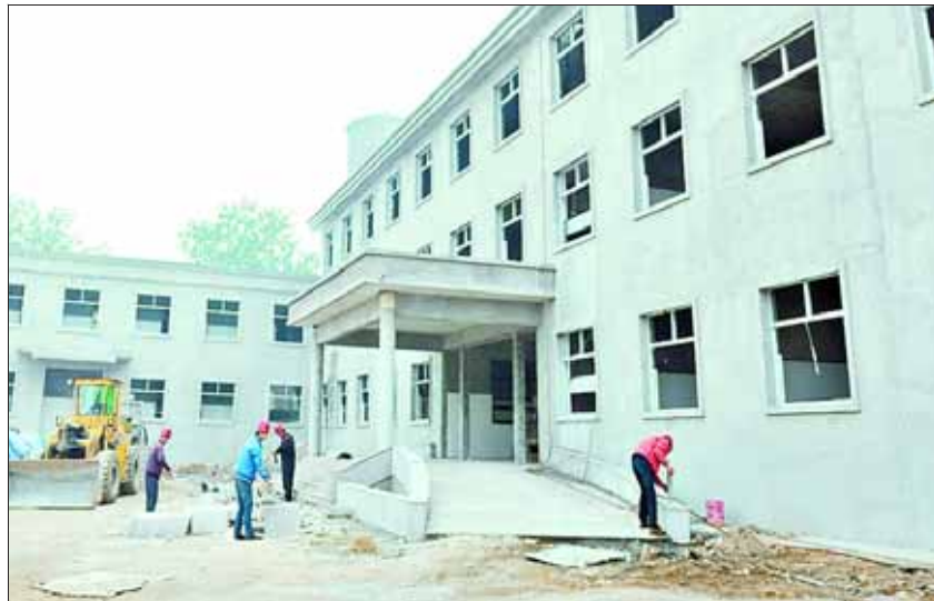
经过8个月的紧张建设,鹤山区中山社区卫生服务中心服务综合楼主体工程完工,目前正在安装室内水、电、暖,预计今年12月底投入使用。建成后的中山社区卫生服务中心设有内外科、中医科、儿科、康复科、预防保健科、B超室、心电图室、检验室、X光等科室,服务辖区3万多名居民。