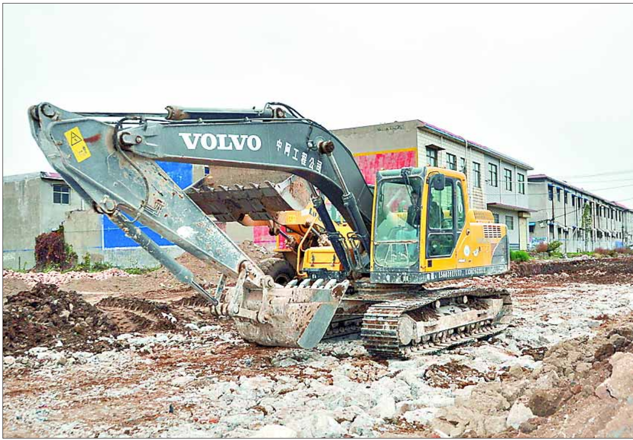
近段时间,淇县对群众反映强烈的出行难问题加大整改力度,投资161.74万元,对城区8条(段)背街小巷进行整治。图为10月27日,泰康路东延道路施工现场。

措施等,让良种补贴政策家喻户晓,调动广大基层干部和农民群众的积极性,努力形成领导高度重视、政府统一组织、部门密切配合、干部积极工作、群众踊跃参与、社会各界支持的良好氛围。 强化项目公示,加强监督检查。对农户良种补贴面积、补贴标准、补贴资金等实行不少于7天的村级公示,并公布县财政、农业部门良种补贴监督电话,接受群众监督。财政、农业部门对项目实施情况进行不定期抽查,及时纠正项目实施过程中出现的各种问题,确保良种补贴政策不走样,农民实惠不减。 (李闪闪 苏麟)