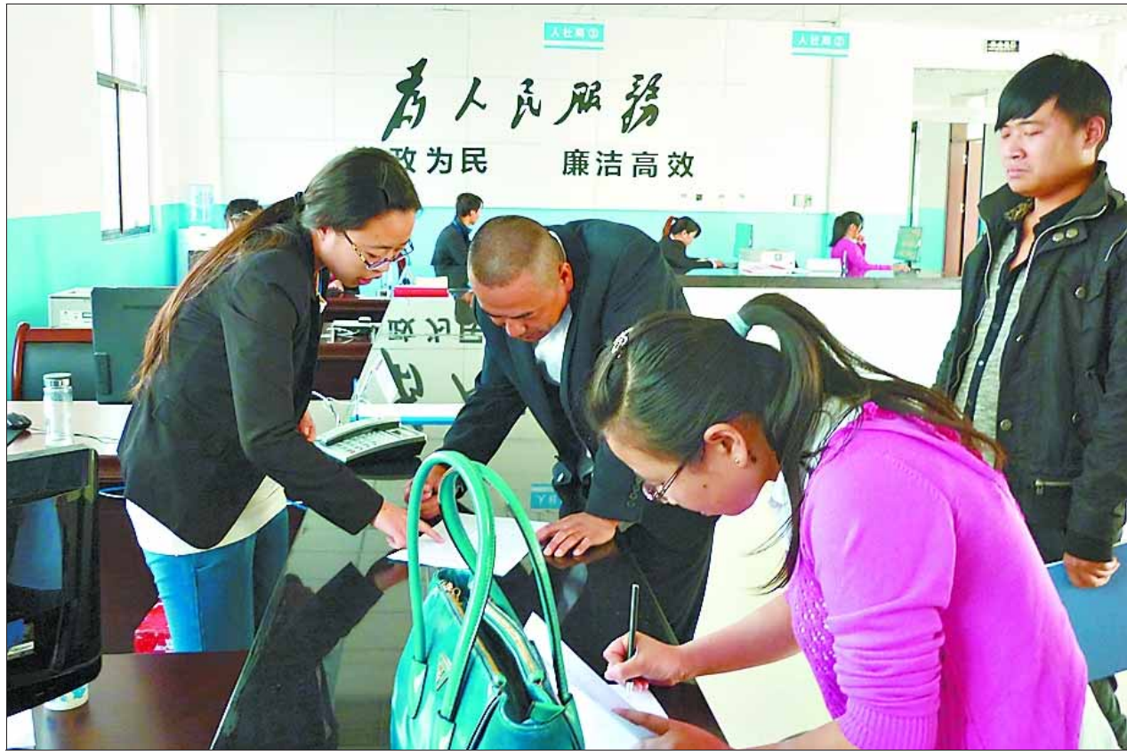
鹤山区行政服务中心自9月28日试运行以来,前来办理业务的群众络绎不绝。截至目前,该中心办理窗口业务400余件。图为群众在区住建局窗口办理业务。

回答及平时工作,进行无记名民主测评。 会后,区纪委综合大会述责述廉、询问质询、民主测评、意见建议等情况,向述责述廉人员反馈,述责述廉人员制订整改措施。对民主测评结果,记入个人廉政档案,作为区纪委出具选拔任用、评先评优证明的重要参考。 (张强、高保军)