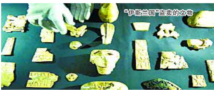
“伊斯兰国”盗卖的文物