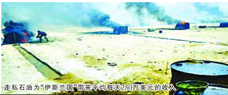
走私石油为“伊斯兰国”带来平均每天250万美元的收入

“伊斯兰国”的“崛起”离不开钱财的支持。目前,这个极端组织已经控制了面积相当于整个奥地利大小的土地和大约800万人口,更不用说它还有一支数万人的武装队伍,如果没有巨额资金支持,一天也维持不下去——