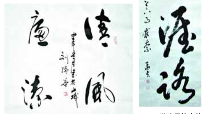
淇滨区检察院 刘瑞华 书