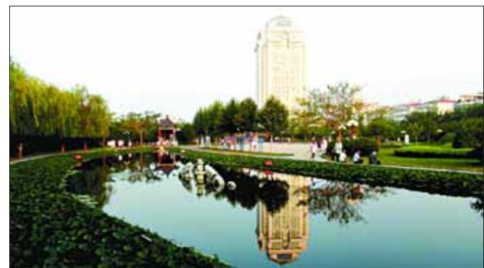
淇滨区检察院 李学海 摄