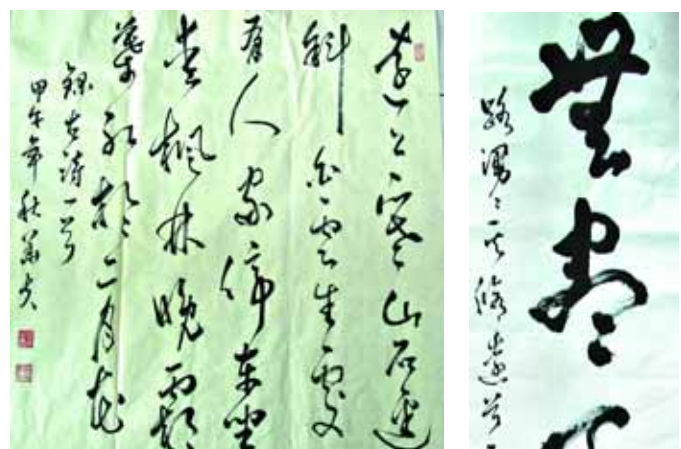
淇滨区检察院 张中华 书