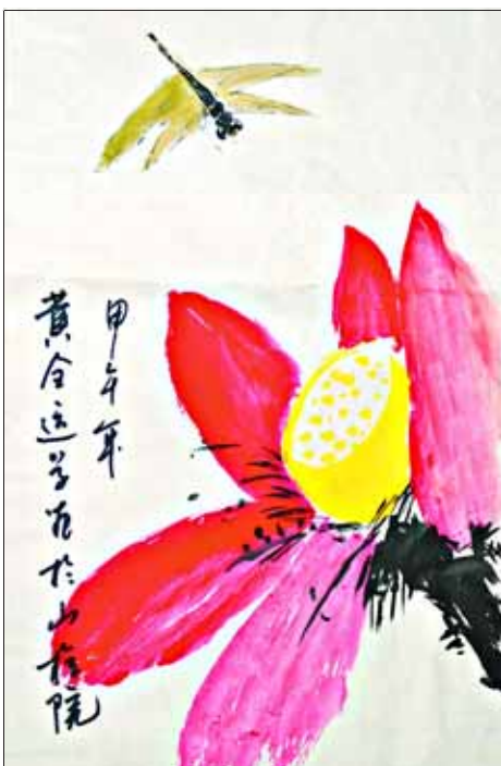
山城区检察院 黄全运 作