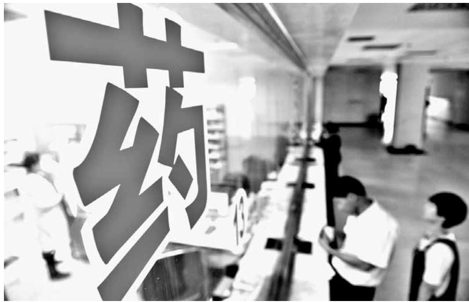
5月5日,在河北省大厂回族自治县人民医院,患者在药房窗口取药。

国家发展改革委5日宣布,我国将于6月1日起取消绝大部分药品政府定价,药品实际交易价格主要由市场竞争形成。药品价格关系百姓切身利益。取消政府限价后,药价会大幅上涨吗?政府怎么管药价?药价改革能否革除“以药养医”弊端?