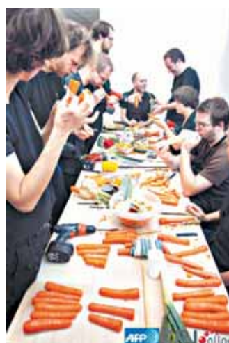
团员们在制作乐器