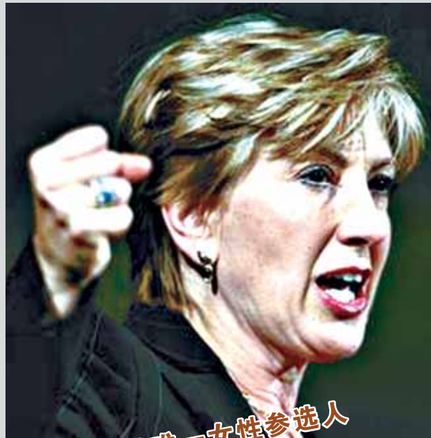
共和党唯一女性参选人