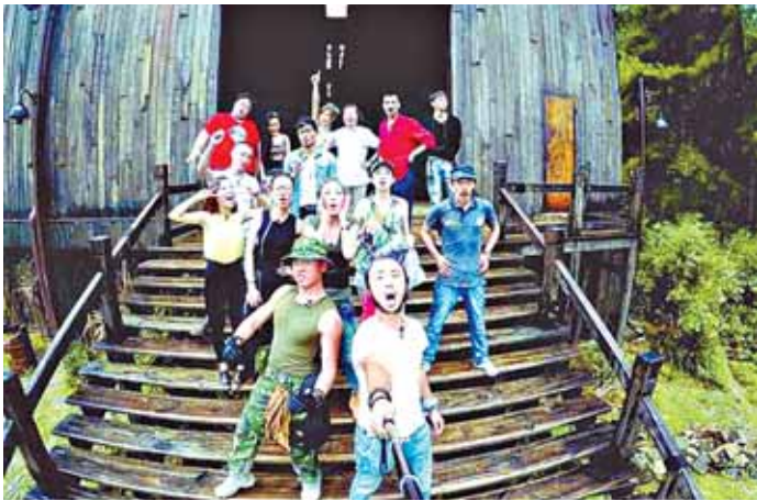
15个“平头居民”的自拍

据中国青年报消息 吊车司机、退役军人、兼职模特儿、退休财务总监、时尚设计师、电商运营总监……这15个职业迥异、年龄分布在20岁-60岁之间的普通人,在近日由腾讯视频制作的网络真人秀节目《我们15个》中有了交集——他们被平移到远离人群、1.2万平方米的荒凉山头的环绕下,用两头奶牛、几只鸡、几株杨梅树和5000元现金,共同生存一年——这一切,网民都可以通过手机24小时观看。