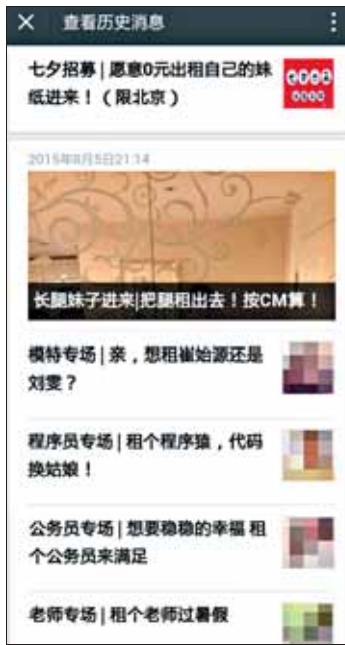
微信租人的公众号截图

租请求,并把对方的微信名片推荐给记者,最后强调该平台只提供信息,其他一切都由双方联系。