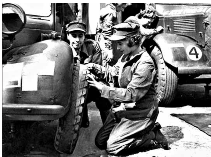
二战中在英军服务的伊丽莎白二世

1936年,德国违反《凡尔赛和约》,派军队进入莱茵非武装区,爱德华八世当即指示时任英国首