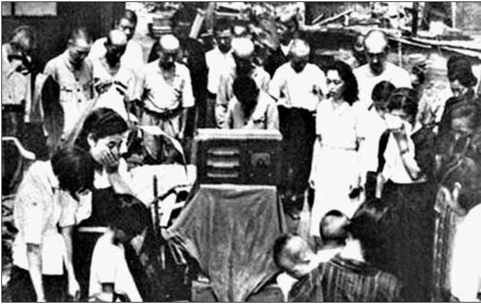
1945年8月15日,日本民众在聆听天皇宣读《终战诏书》,日本向盟国无条件投降。

上海,全面侵华战争爆发。日本军部狂言“3个月内征服中国”,但中国军民顽强抵抗,正面战场和敌后战场同时发力,百余万侵华日军陷入中国战场,速战速决的侵华战略彻底破产。1939年8月,苏军在中东战场重创关东军,“北进”受挫,转而“南进”。