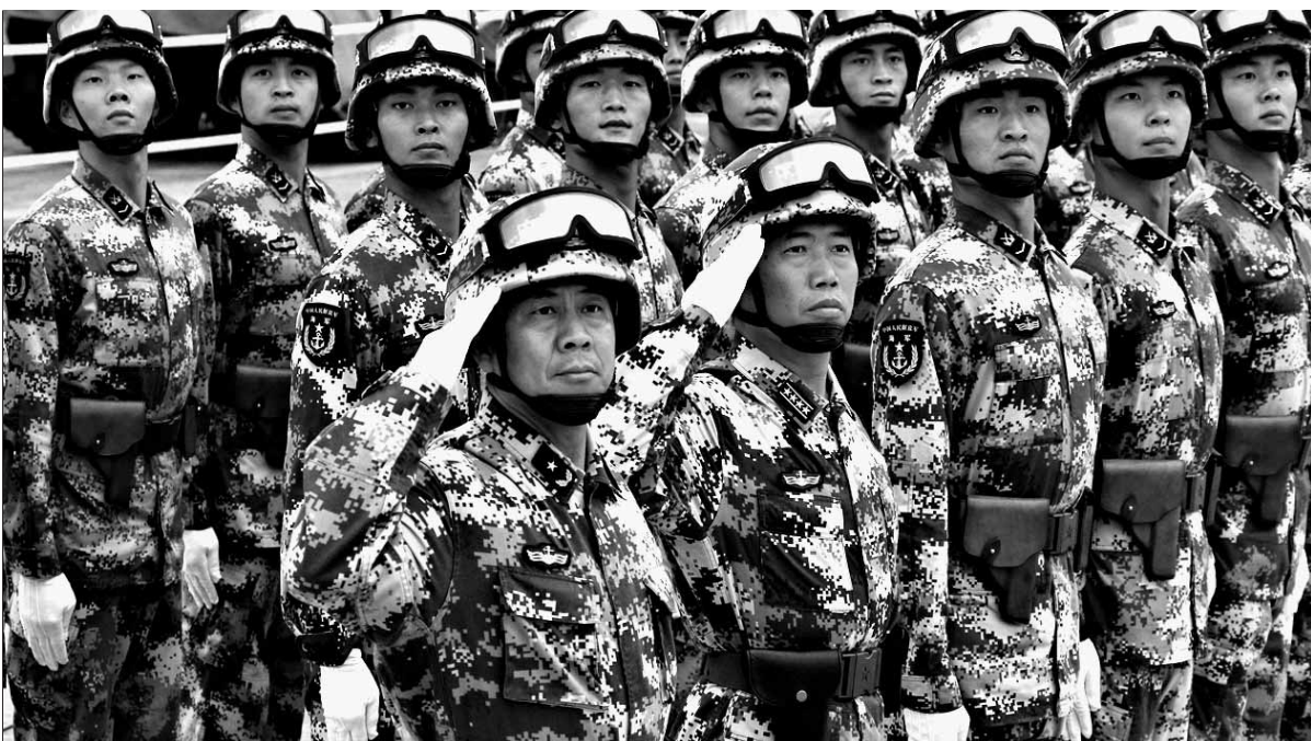
“上天能驾机,下海能操舰”的李晓若少将,担任陆战两栖突击车方队将军领队(前左一)同方队士兵一起训练。

在人民大会堂将举行纪念中国人民抗日战争暨世界反法西斯战争胜利七十周年文艺晚会《胜利与和平》。晚会总时长90分钟,全面展示14年的抗战历程和抗战胜利70年来中国人民在和平发展道路上的奋斗历程。(据《北京青年报》)