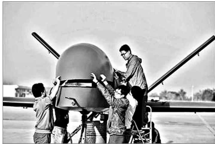
地面人员为彩虹5做保养