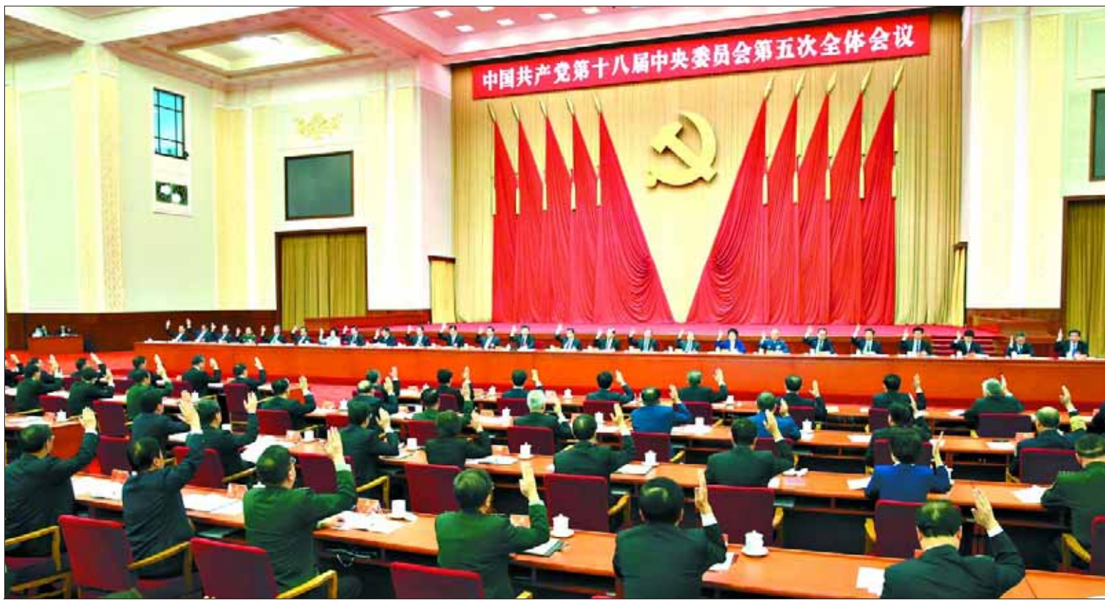
中国共产党第十八届中央委员会第五次全体会议,于2015年10月26日至29日在北京举行。中央政治局主持会议。