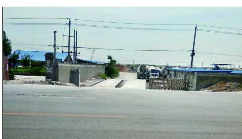
圣大砷业分站门口处未进行有效清扫,院内料堆未完全覆盖等问题被检查人员发现。

本报讯(记者 李旭阳 通讯员 崔珊珊)近日,市大气污染防治综合督查组对我市大气污染防治工作进行了随机暗访,在暗访中发现,大部分道路进行了清扫保洁,土方堆场采取了覆盖措施,环境质量有所改善。但仍有部分企业扬尘防治措施不到位。