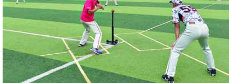
青少年软式棒垒球比赛现场。

经过两天的激烈比拼,科达中学、湘江中学、鹤壁高中分获中学组前3名,湘江小学、淇滨小学、明达小学分获小学组前3名。