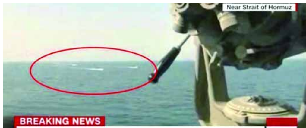
4艘伊朗军舰在霍尔木兹海峡附近对美国一艘驱逐舰进行高速拦截。(视频截图)

“我们认为这种拦截既不安全也不专业。”雷恩斯在一份声明中说。而路透社则援引一名要求匿名的官员称,“伊朗(军舰)……制造了危险和骚扰,这种情况可能会导致事态进一步扩大,包括可能会让‘尼采’号采取进一步防卫行动”。