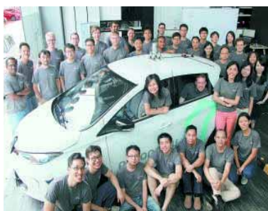
参与试乘活动的人们

无人驾驶出租车在新加坡上路了!从8月25日开始,受邀的用户可以通过智能手机呼叫nuTonomy公司的无人驾驶出租车来免费使用。