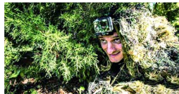
躲猫猫大赛(资料图片)

据新华社8月26日电,玩过躲猫猫吗?你可知道,这个孩童们的游戏也是有世界锦标赛的。不过参赛选手必须是成年人。躲猫猫世锦赛最早由意大利小杂志社CTRL Magazine在2010年举办,后来演变成一年一度的赛事。