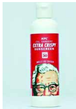
肯德基“劲脆防晒霜”

据新华社8月26日电,肯德基推出新品了!等等,为什么是防晒霜?这与鸡有关系吗?当然有!因为它是炸鸡味儿的!