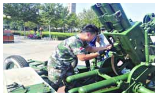
人工影响天气技能比赛