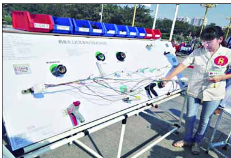
汽车线束装配比赛