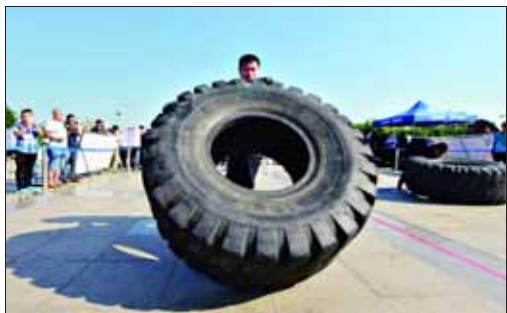
翻轮胎体能竞技比赛