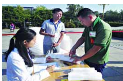
快件收派模块比赛