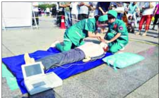
双人心肺复苏比赛