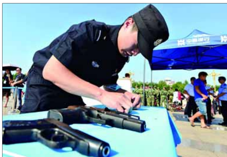
枪支分解结合比赛