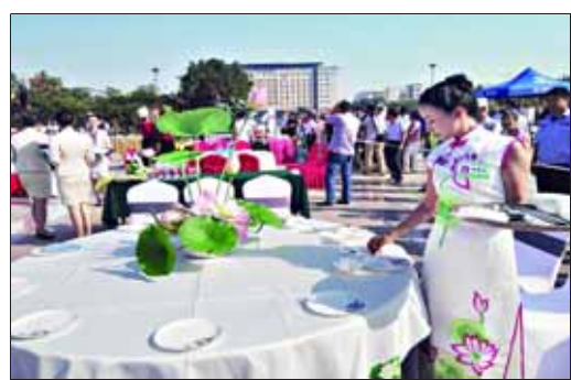
中餐宴会摆台比赛