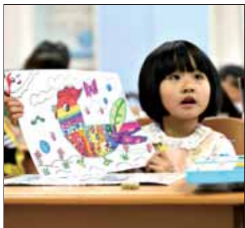
1月6日,山东青岛济实学校的小学生展示地创作的“金鸡”题材绘画作品。