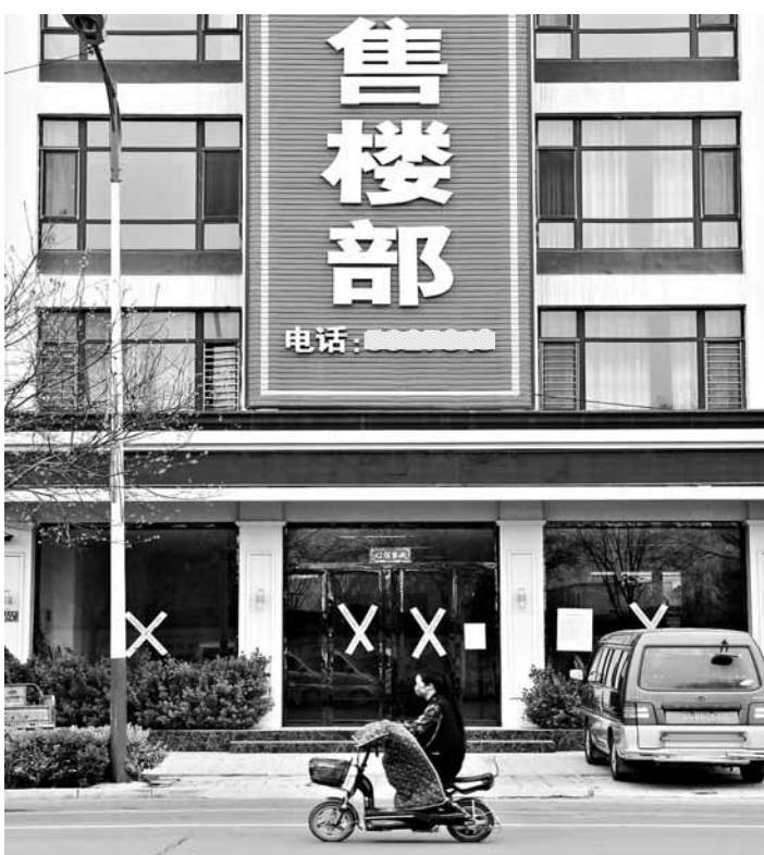
河北省安新县一处被关闭的售楼部。新华社记者 王晓 摄

高阳县5日起暂停向拥有城区规划范围内3套及以上住房的本县户籍居民家庭出售城区新建商品住房及二手住房。暂停向拥有城区一套及以上住房的非本地户籍居民家庭出售城区新建商品住房及二手住房。第二套商品住房首付比例不低于60%,认房又认贷。