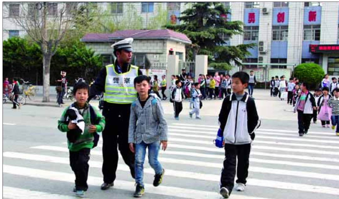
连日来,淇县公安局交警大队针对学校周边道路接送学生的车辆较多,各种机动车、非机动车混杂拥挤等情况,在城区学校附近路段增派“护学岗”,确保学生上、下学期间交通安全。

找到老人时,老人双腿满是泥渍,脚上穿的黑色棉布鞋上全是泥水,身体还不时发抖。民警赶紧将老人带回中队,一边通知其家属,一边为老人端上热汤。迅速赶到大河涧社区中队的魏先生看到老人安全无恙,连声向民警致谢。