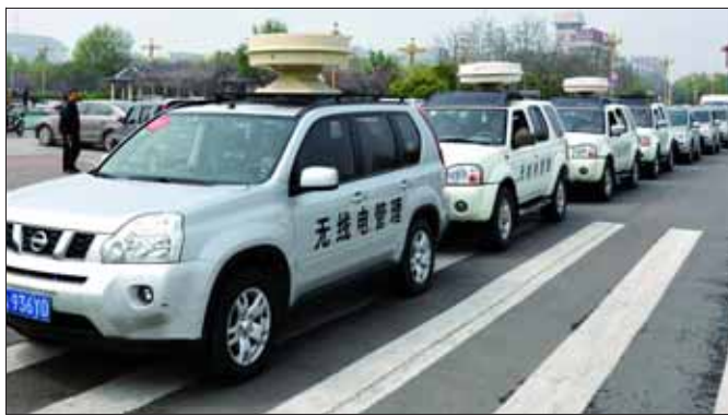
鹤壁、安阳、濮阳市的无线电监测移动车拉网式排查各类非法台站。

技术参数的、设备因长期使用老化的、多个发射天线共塔广播台站,一旦发现对航空安全等频率产生有害干扰的立即停止播出,采取有效措施消除干扰,依法处理。“我局作为此次专项行动的牵头责任单位,认真制订了排查方案,并合理调配技术人员和设备,明确职责分工。专项行动结束后,我们将把该项工作作为一项长期任务来抓,防止‘黑广播’等非法台站死灰复燃,确保航空专用频率安全。”河南省航空专用频率保护第五监测执法队指挥长、鹤壁无线电管理局局长张贵宝说。