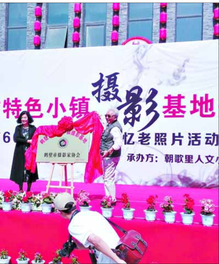
鹤壁市特色小镇摄影基地揭牌仪式现场。本报记者 靖桂宇 摄

浚县纪委紧盯穿上“隐身衣”、躲进“青纱帐”的隐形变异“四风”问题,自去年年初以来——