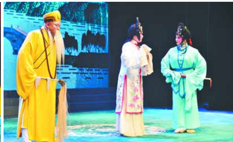
《法海禅师》现场演出照。