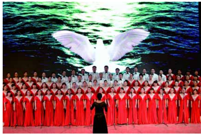
浚县实验小学合唱队在演唱《祖国颂》。