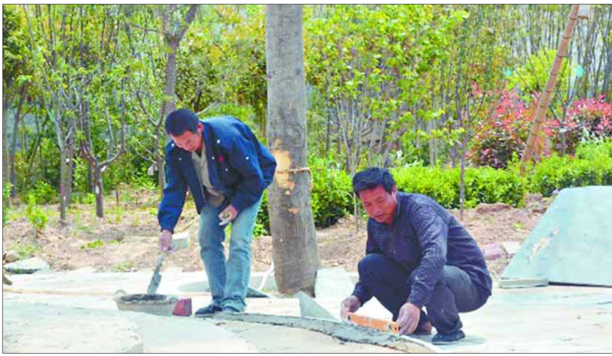
浚县古城保护建设工作有序推进,图为日前建筑工人在加紧施工。

重业务,做“安专迷”式的组工干部。大力弘扬“安专迷”精神,开展“组工论坛”、业务专题讲学、实地观摩等