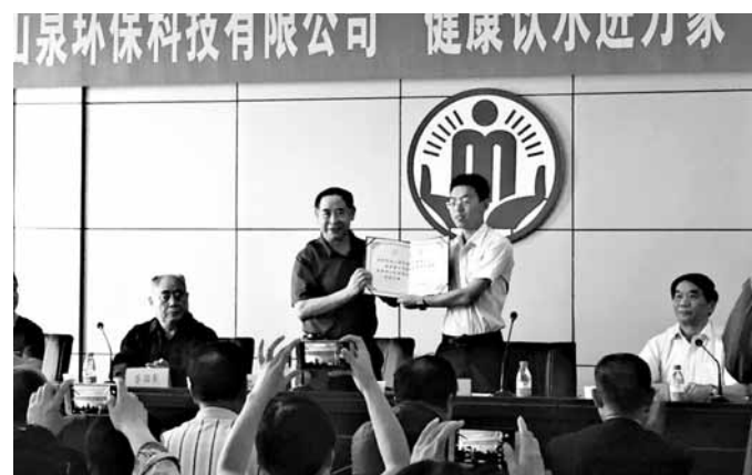
捐赠物资证书颁发现场。

本报讯 (记者 陈海寅) 6月6日,一场充满爱心的捐赠仪式在市慈善总会举行。深圳市青山泉环保科技有限公司现场捐赠了500台净水机,价值近200万元。