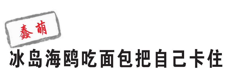
据《环球时报》消息 吃个面包结果把自己卡住?近日冰岛阿克拉内斯一只蠢萌的海鸥就干了这么一件蠢事。这只饥肠辘辘的海鸥看到面包后冲上去就是一口,但可能是因为长喙太尖,它还没张开的嘴巴直直把面包戳了个洞,然后就把自己卡在了面包圈里。最终,在一番努力后,这个小家伙终于摆脱面包圈,对着美食大快朵颐。