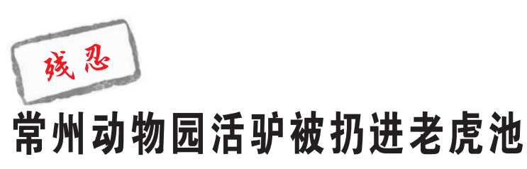
据《现代快报》消息 6月5日,江苏常州淹城野生动物园遭遇突发事件,不过这次老虎咬的不是人,而是一头驴。下午2时49分,网友在本地论坛上发帖称“淹城动物园竟然将一只活生生的动物喂给老虎!太残忍了!”