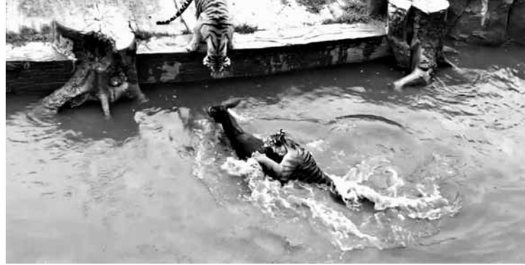
据《现代快报》消息 6月5日,江苏常州淹城野生动物园遭遇突发事件,不过这次老虎咬的不是人,而是一头驴。下午2时49分,网友在本地论坛上发帖称“淹城动物园竟然将一只活生生的动物喂给老虎!太残忍了!”