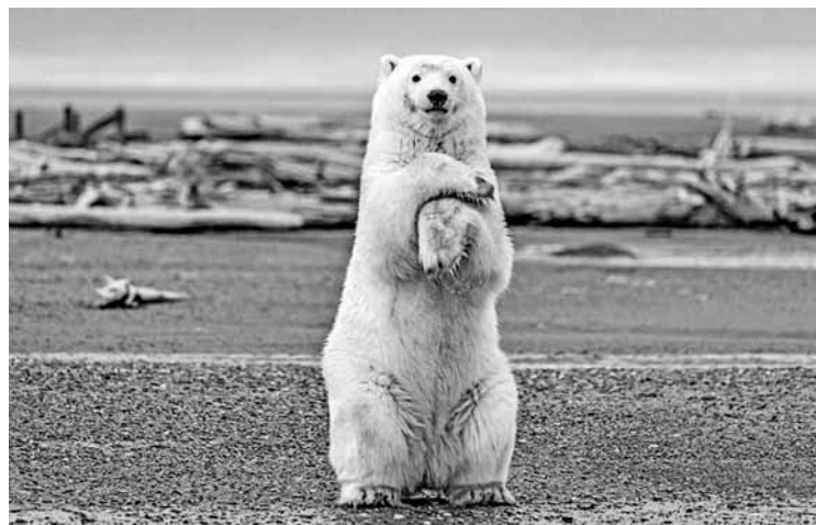
据《环球时报》消息 日前,美国阿拉斯加州卡特维克附近的一只小北极熊竟然在摄影师劳拉·格雷戈里(Laura Gregory)的镜头前摆起了Pose,模样憨厚,萌翻众人。

有研究结果显示,每增加1小时户外活动,近视发生率就减少10%。因此,眼科专家建议青少年要把增加户外活动作为每天的“必修课”,学习累了就远眺几分钟。