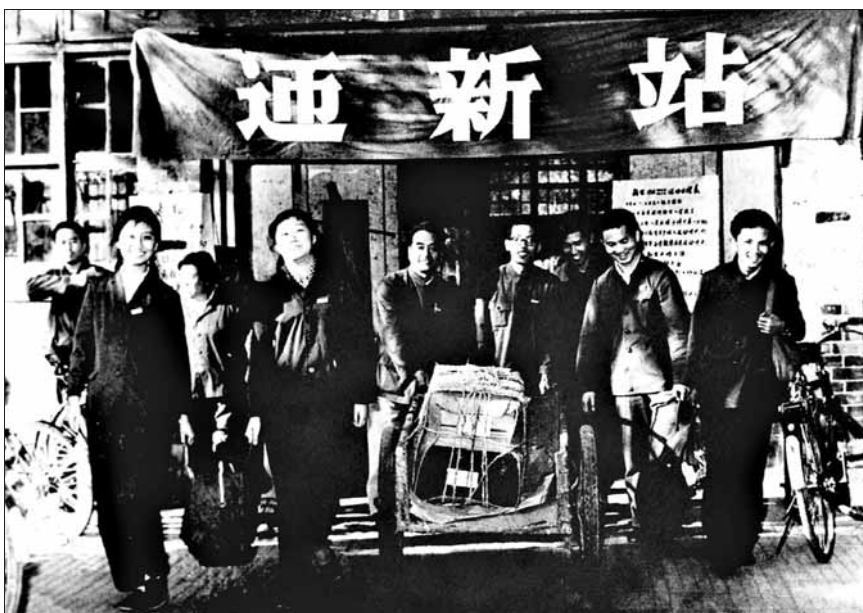
1978年春,北京大学迎来恢复高考后录取的第一批新生(资料照片)。

40载岁月如歌,已是“不惑”之年的高考,依然继续着选拔人才、服务国家的神圣使命。