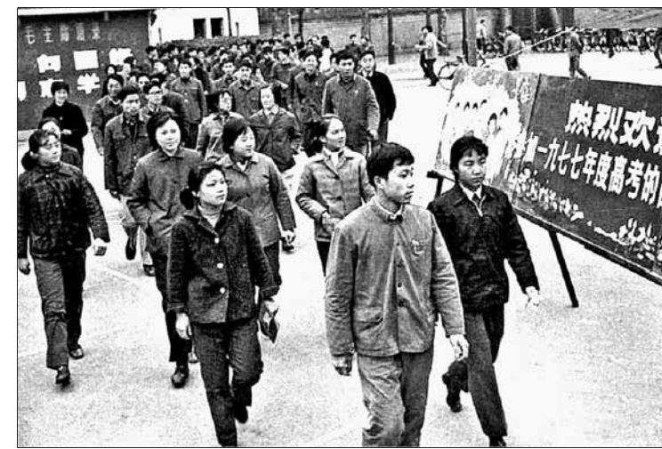
1977年,参加高考的考生们走进考场时的情景(资料图片)。

又到了一年一度的高考季,青年学子们即将走进考场。但很多青年学子或许并不清楚40年前的情形:1977年8月7日的一份《科教工作座谈会简报》成为千万人心中最珍贵的文件,甚至成为全国思想解放的先导。这份文件意味着,中断了11年的高考制度正式恢复,也迎来了尊重知识、尊重人才的春天。