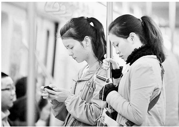
□新华社记者 姜琳 张辛欣