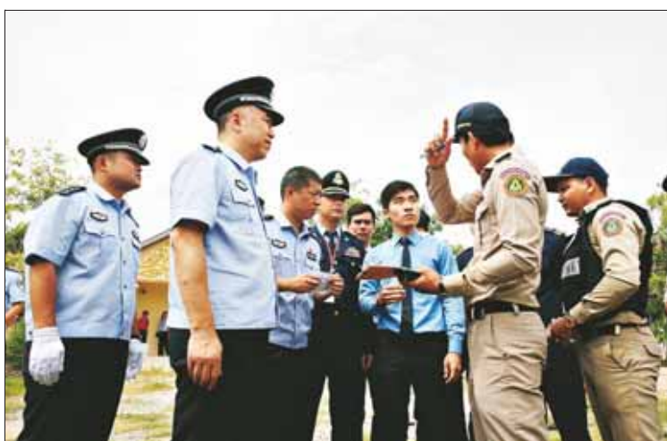
工作组与柬埔寨警方、暹粒机场工作人员协商带涉案人员快速通关。