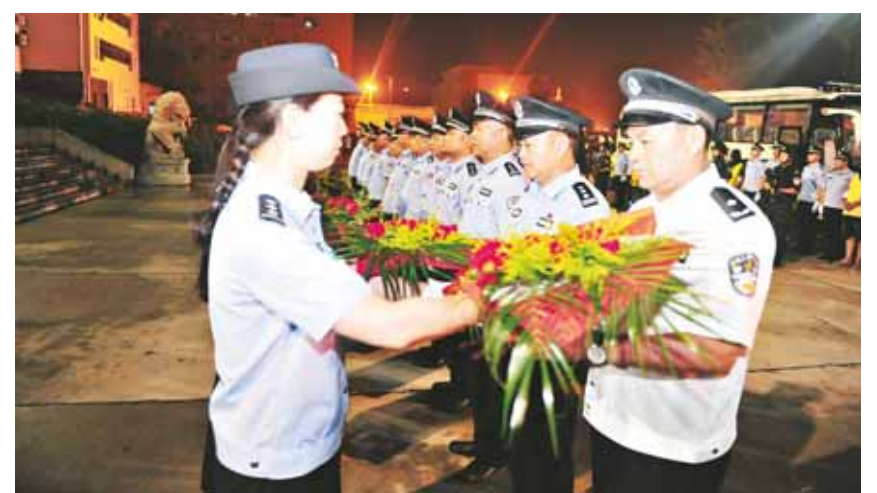
欢迎仪式上,民警代表向工作组成员献花祝贺。