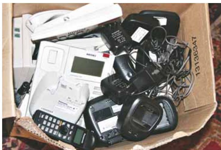
在柬埔寨诈骗窝点缴获的话机、交换机等作案工具。

此次出境打击,成功摧毁了一批藏匿在柬埔寨,从事网络敲诈勒索、冒充公检法以及虚假网络购物诈骗活动的犯罪团伙,有力打击了犯罪分子的嚣张气焰。