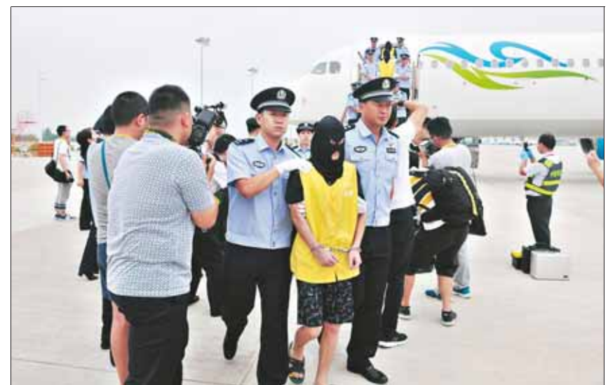
市公安局赴柬埔寨工作组押解犯罪嫌疑人到达郑州新郑国际机场。

7月17日,在我国驻柬埔寨王国大使馆警务联络官的全力协调及柬埔寨内政部移民总局的支持下,我省警方和四川警方对涉案窝点开展了第二次集中收网行动,一举抓获犯罪嫌疑人31名,其中台湾籍犯罪嫌疑人7名,网上在逃犯罪嫌疑人10名,缴获大量作案工具。