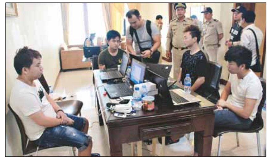
诈骗窝点抓捕现场。

决不空手而归,誓为河南警方争光的坚定决心,多次往返于金边等地开展工作,充分发扬了我市公安机关勇于担当、务实重干、克难攻坚、无私奉献的精神,以及顽强的敬业精神和高超的侦查水平,充分展示了河南公安的良好形象。