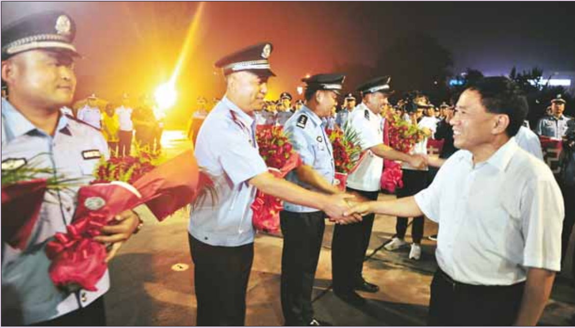
市委书记范修芳慰问此次赴外执行任务的民警。