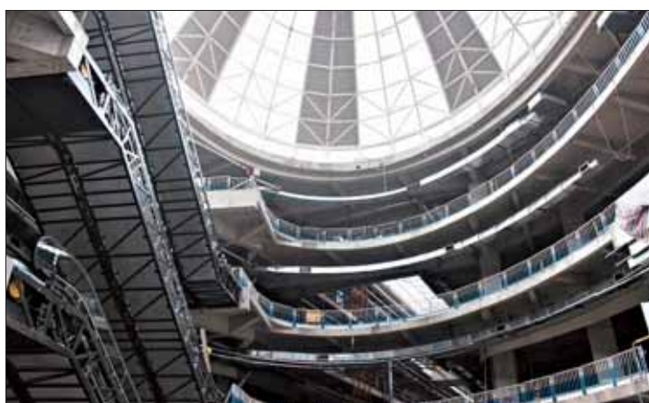
鹤壁万达广场内部。