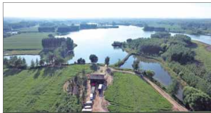
治理中的汤河鹤鸣湖景区景色壮美。