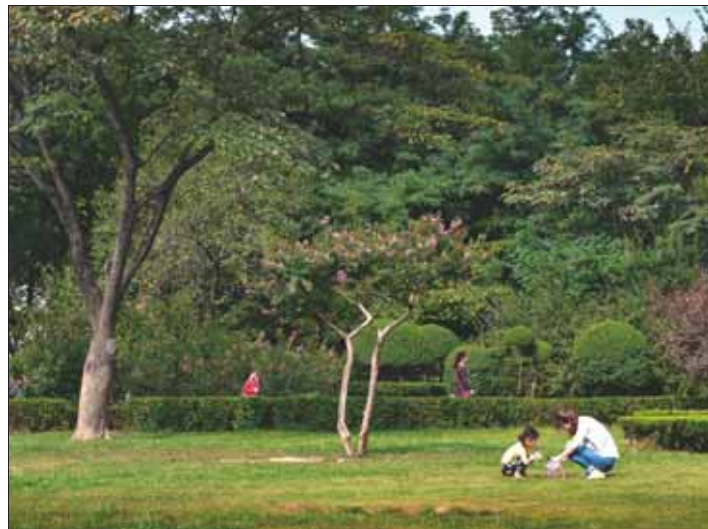
一对母女在街心公园草地上玩耍。

生态文明建设功在当代,利在千秋。党的十九大报告明确指出,牢固树立社会主义生态文明观,推动形成人与自然和谐发展的现代化建设新格局。“国家园林城市”国字号名片来之不易,谈及下一步工作打算,常玉轩说:“我市将被命名为国家园林城市,是全市上下共同努力的结果,也给我区园林绿化建设提出了新的更高要求。我们将持续扩大创建成果,进一步建立健全常态化、长效化的工作机制,以文明城市创建暨百城建设提质工程为抓手,全面提升城市建设管理水平,不断满足人民群众对美好生活的期待。”