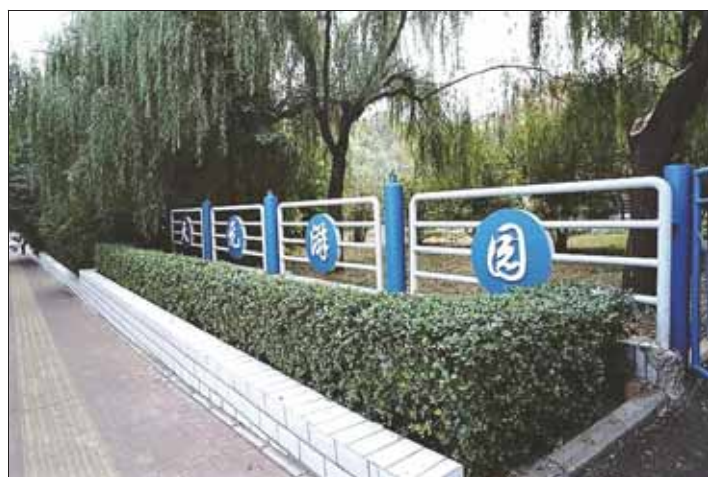
新落成的天元游园(山城路与汤河街交会处西南角)。