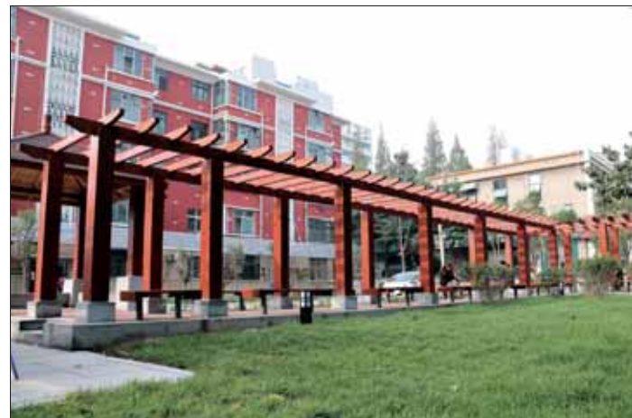
新落成的心苑游园(位于山城区红旗街中段)。

据了解,近年来,山城区累计投入园林绿化建设维护专项资金5626万元,园林绿化工作取得长足发展,建成区绿地面积达304.8万平方米,其中公园绿地面积约75.34万平方米;建成区绿地率为31.68%,绿化覆盖率达36.2%,人均公园绿地面积为6.76平方米,道路绿化普及率为100%,基本形成“三季有花、四季常青、道路林荫化、绿地功能化”的绿化格局,有效满足了广大市民对城市的生态休闲需求,各项指标达到了国家园林城市标准要求。