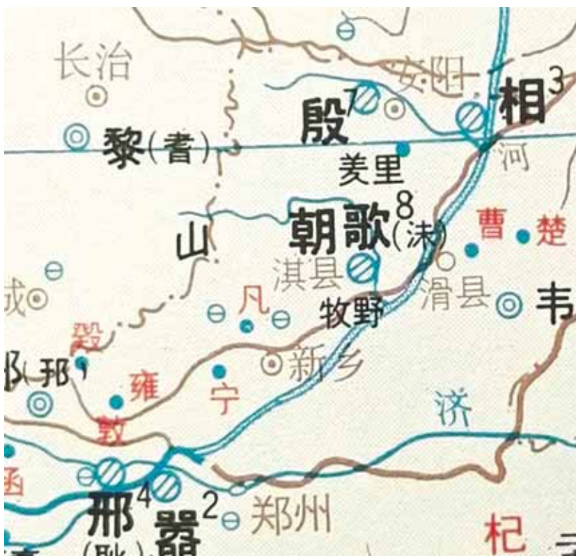
河淇间示意图(地图选自郭沫若《中国史稿地图集》)

比如全国重点文物保护单位“卫国故城”,现存有四段古城墙。作为康叔卫国的国都,淇县现在还保留有四段卫国古城墙,分别在现朝歌文化广场南、京广铁路老煤建公司、银河纱厂至医药公司院内、县林业局院内,残高5至8米、长30米到1000多米。最长的一段卫国古城墙是朝歌文化广场南那一段,残高2米到3米,长达1000多米。2006年,国务院将“卫国故城”公布为