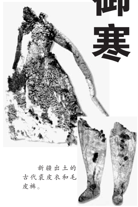
新疆出土的古代裘皮衣和毛皮裤。