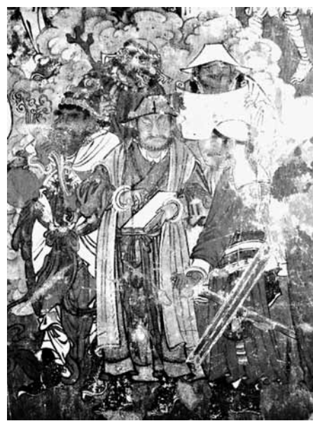
河北石家庄毗卢寺明代壁画中穿皮衣、戴瓦楞帽的元代吏卒。

用青色布帛为裘、羔皮为里的冬衣叫“青羔裘”,这是秦汉时贵族的冬装。汉刘歆《西京杂记》中记载,有人献弹棋,汉成帝十分高兴,“赐青羔裘,紫丝履,服以朝觐。”而在先秦时,还流行用白色丝带,即“素丝”装饰皮衣缝。《诗经·国风·召南》中的《羔羊》称:“羔羊之皮,素丝五紵(tuó)。”用素丝装饰的羔羊裘叫“英裘”,是一种精美的皮毛。