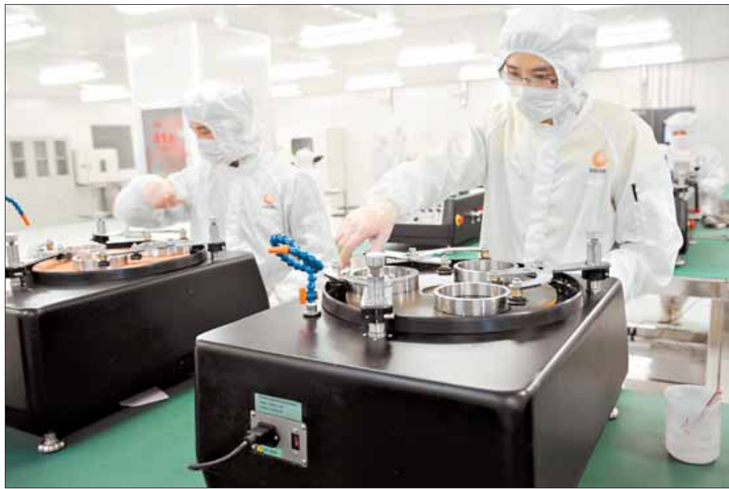
任佳光电子产业园引来一批“高精尖”企业,形成了芯片、模块、光连接器、封装、光纤光缆等完整的产业链。图为河南任佳光科技股份有限公司切磨抛车间内,技术人员正在将晶圆(硅半导体集成电路制作所用的硅晶片,由于其形状为圆形,故称晶圆)切割成一枚枚芯片。

走进位于鹤壁国家经济技术开发区的任佳光电子产业园,一片“光电”招牌,这里聚集了多家光电子企业。依托河南任佳光科技股份有限公司,我市规划建设了总投资20亿元、建筑面积17