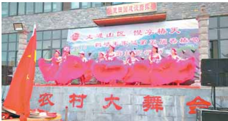
4月6日,鹤山区姬家山王家地第五届香椿节开幕。