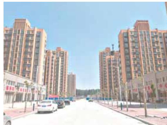
淇县易地扶贫搬迁安置区雨露社区实景。