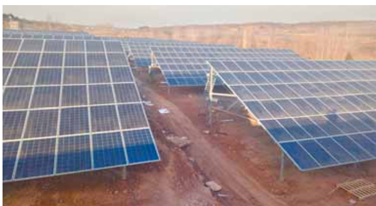
鹤山区12个村级光伏电站目前已全部并网运行。