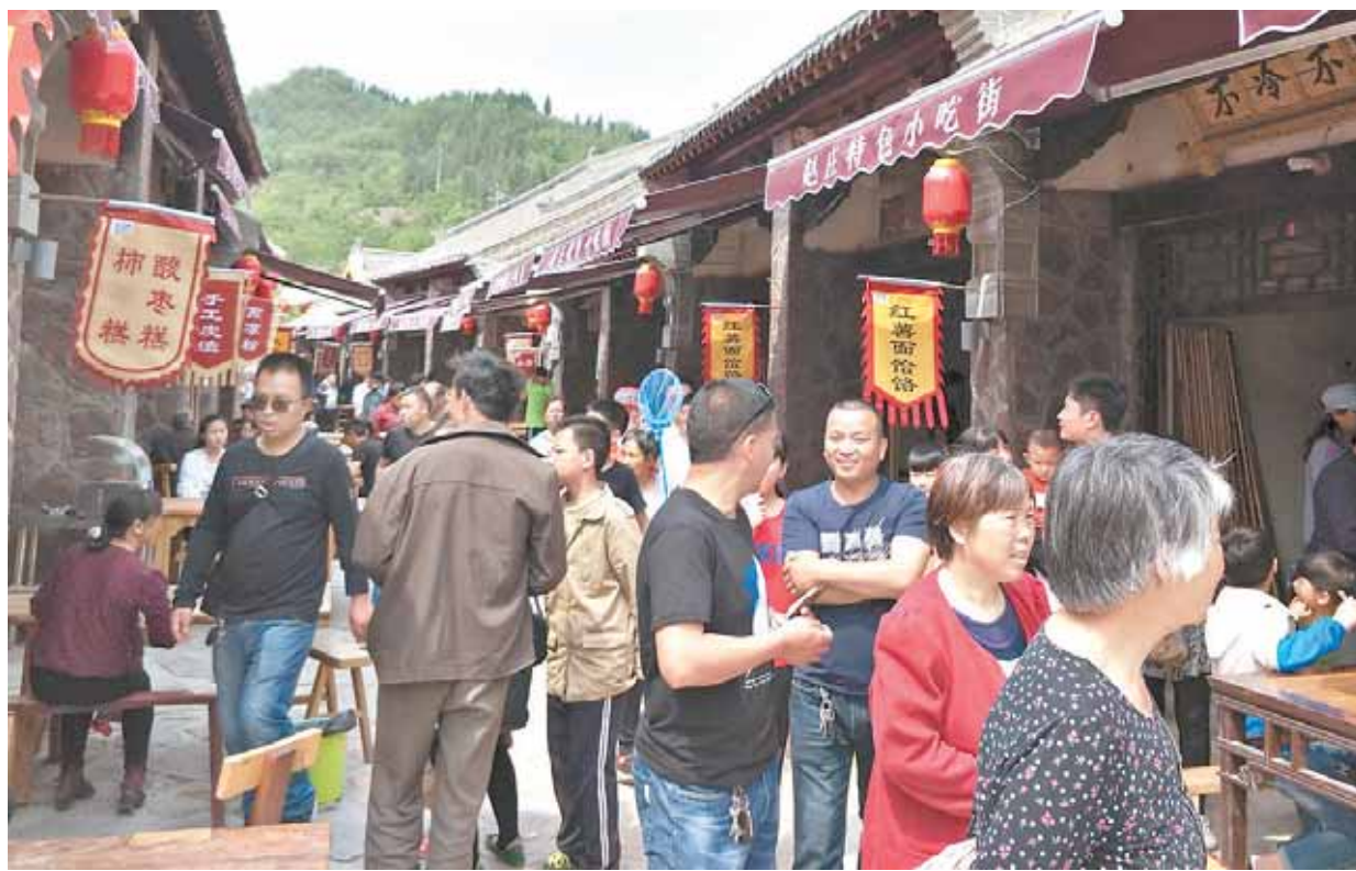
灵山“赵庄味道”乡村旅游产业扶贫基地,是淇县推进全域旅游、助力脱贫攻坚的又一硕果。