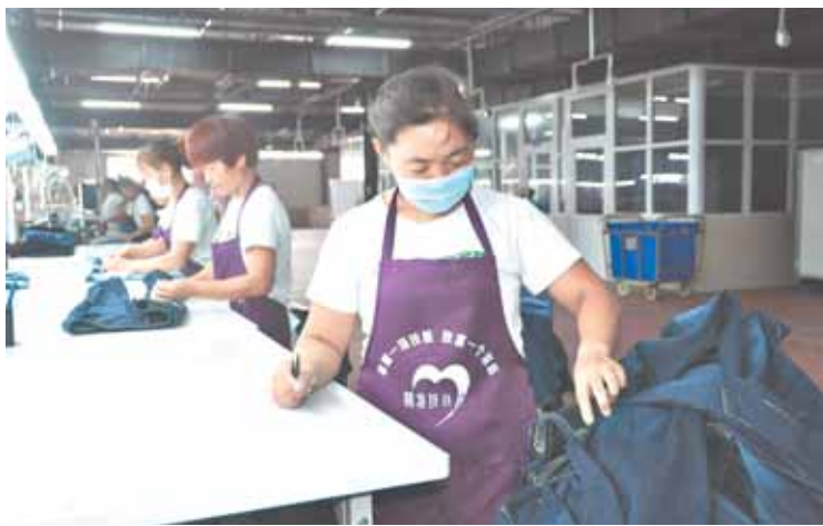
淇县新口服装有限公司是全县56个产业扶贫基地之一,宽敞明亮的车间里,工人正在生产线上忙碌。

淇县召开全县扶贫开发工作会议,围绕完善制度体系、夯实基层基础、推进项目建设、加强帮扶措施、开展干部培训、督查问责落实、易地扶贫搬迁7项重点工作,制定出台