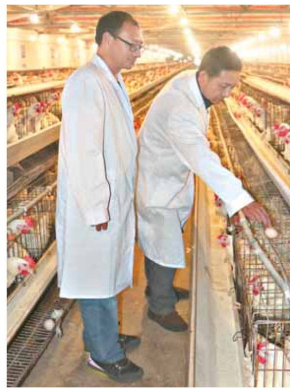
浚县奉献禽业有限公司用实际行动助力扶贫,为16名贫困群众提供就业岗位,帮助群众持续增收、稳定脱贫。