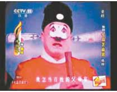
牛得草《七品芝麻官》剧照。