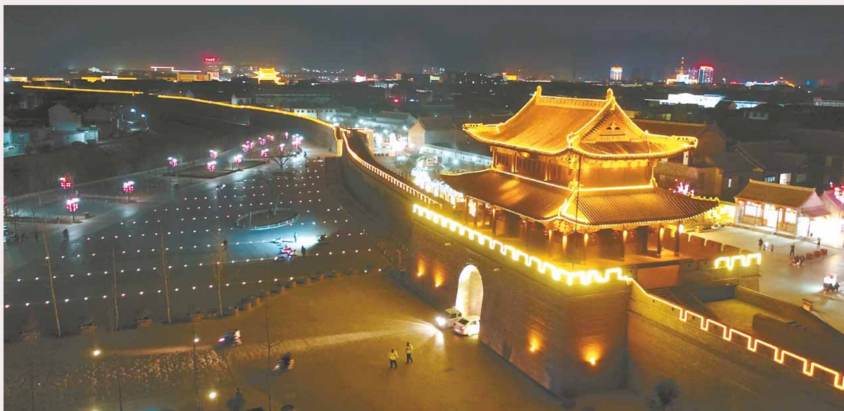
浚县古城夜景,古老与现代交相辉映。