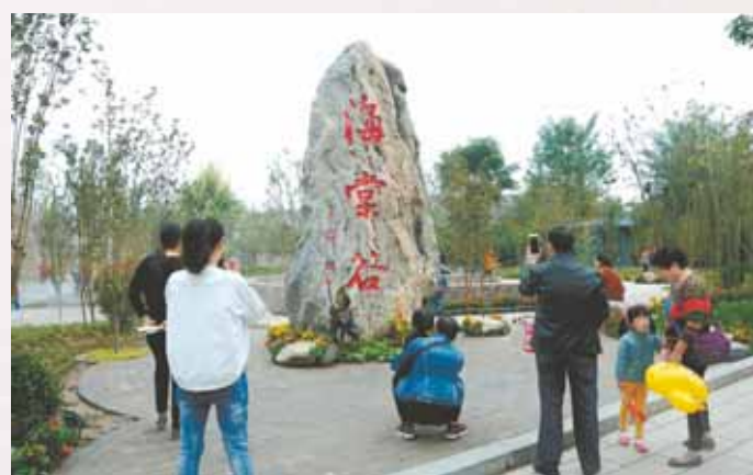
海棠谷位于连接浚县西城门和北城门的城墙内侧,因种植6000多株品种多样的海棠树而得名。