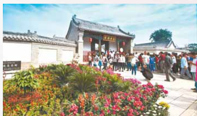
浚县县衙,大门前有照壁,大门内有仪门、大堂、二堂、三堂及房科,县衙东部有典史署、县丞署,西侧有监狱、花厅等。