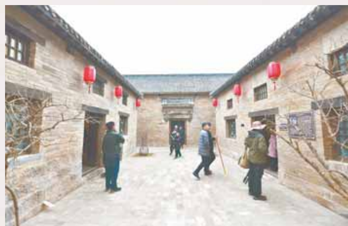
风情四合院位于浚县古城县前街东侧,拥有明清建筑50余座,包括刘家大院、王家老宅、著名数学家刘亚星故居等。