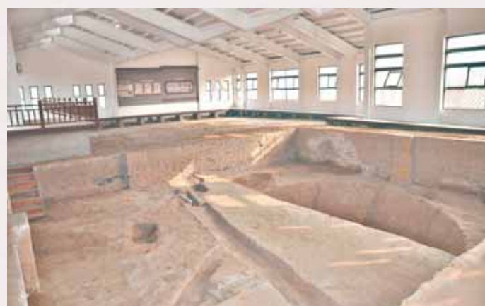
浚县黎阳仓遗址距今已有1400多年历史,该仓约可存粮3360万斤。