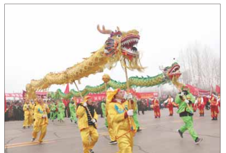
2月19日,淇县朝歌文化广场上鼓乐齐鸣,数万名群众在此观看元宵民俗社火表演。来自淇县各乡镇(街道)的120支民间社火表演队轮番上场,给大家带来了舞龙、舞狮、踩高跷、划旱船等社火表演。

监督;聚焦精准惩治,紧盯重大工程、重点领域、关键岗位,实施助推民营企业发展壮大“护航工程”,构建亲清政商关系,实施案件查办“提质增效”行动,提升办案质量和效率;聚焦突出问题,把握政治定位,抓实问题整改,推动巡察监督全覆盖;聚焦以案促改,强化“案”的警示,紧盯“改”的重点,突出“建”的长效,营造“廉”的氛围,一体推进“三不”机制;聚焦民生民利,严查侵害群众利益的问题,切实解决群众反映强烈的突出问题。要从加强自身建设,锻造忠诚干净担当的纪检监察干部队伍,全力服务淇县经济社会高质量发展。