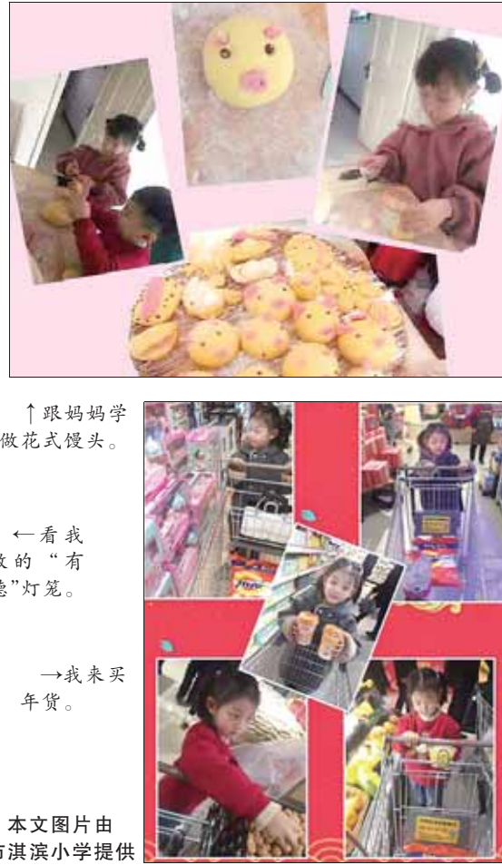
↑跟妈妈学做花式馒头。