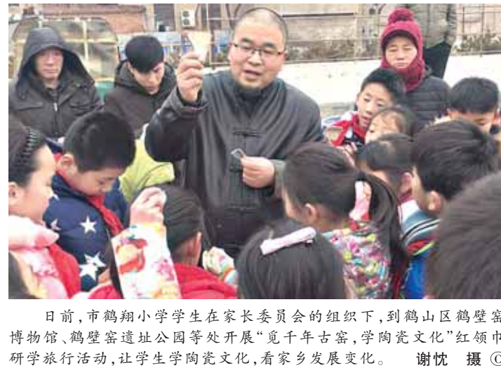
日前,市鹤翔小学学生在家长委员会的组织下,到鹤壁山区鹤壁窑博物馆、鹤壁窑遗址公园等处开展“览千年古窑,学陶瓷文化”红领巾研学旅行活动,让学生学陶瓷文化,看家乡发展变化。