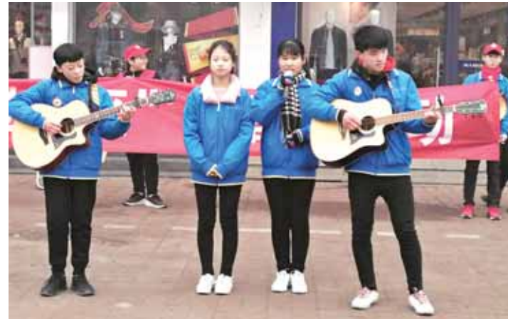
2月20日,市第七中学组织学校艺术团志愿服务队到学校周边福祥社区等处开展“文艺进社区、学雷锋志愿服务”活动,倾情演绎了丰富多彩的节目。