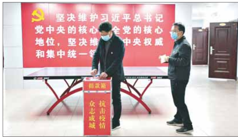
2月12日下午,市委政法委员会组织开展捐款活动,全体干部职工自愿捐款助力抗击疫情,以实际行动支援疫情防控工作,活动现场共捐款9500元,为新冠肺炎疫情防控工作奉献一份力量和爱心。

委员有担当,政协有力量。在疫情面前,广大政协委员竭尽所能,为遏制疫情扩散、夺取防控斗争胜利作出了应有的贡献。(苏清芳)