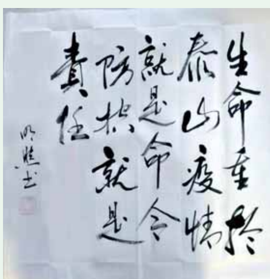
生命重于泰山 疫情就是命令 防控就是责任