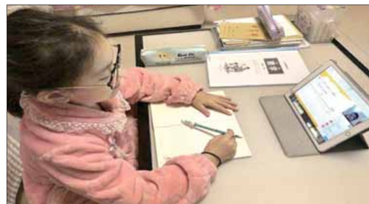
市福田小学四年级学生正在上网课。