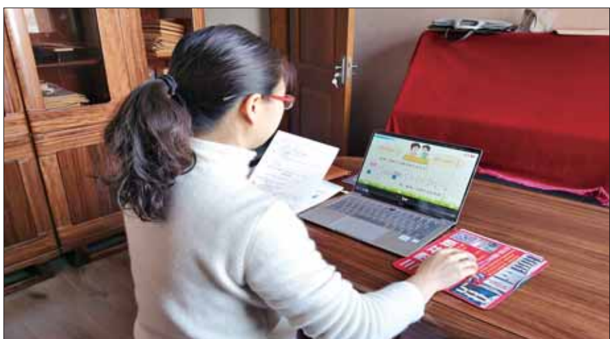
市桃源小学教师在播放网络微课。