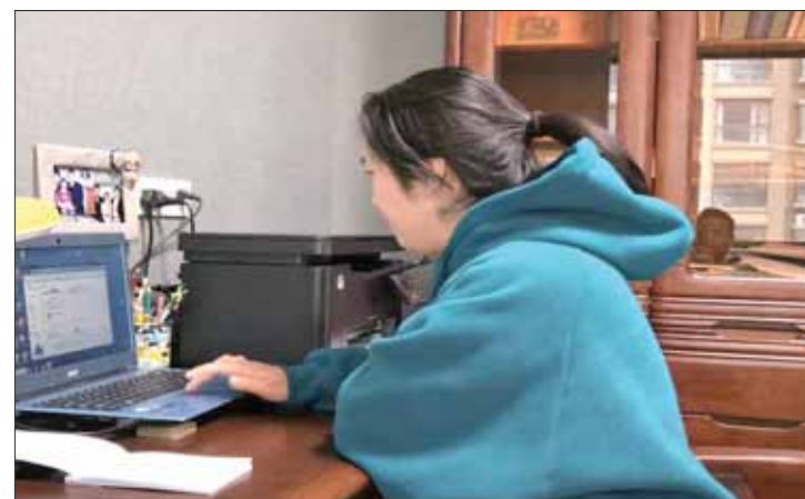
淇滨区明达小学教师正在进行线上教学。