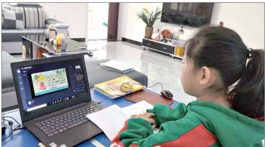
市淇滨小学学生正在上网课。