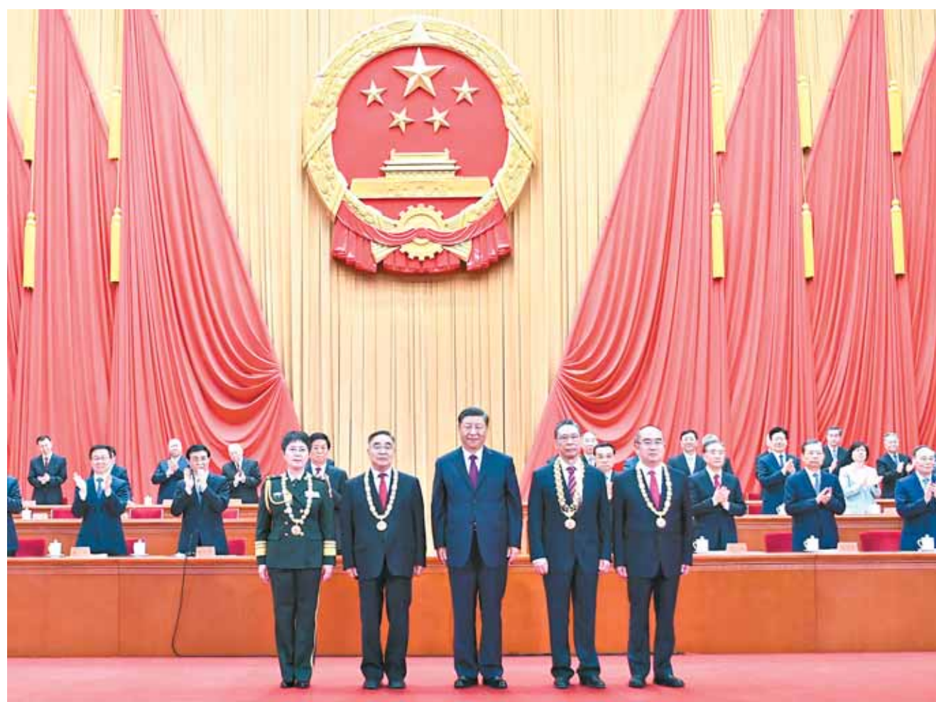
中共中央总书记、国家主席、中央军委主席习近平向“共和国勋章”获得者钟南山(前排右二)、“人民英雄”国家荣誉称号获得者张伯礼(前排左二)、张定宇(前排右一)、陈薇(前排左一)颁授勋章奖章。

新华社北京9月8日电 全国抗击新冠肺炎疫情表彰大会8日上午在北京人民大会堂隆重举行。中共中央总书记、国家主席、中央军委主席习近平向国家勋章和国家荣誉称号获得者颁授勋章奖章并发表重要讲话。习近平强调,抗击新冠肺炎疫情斗争取得重大战略成果,充分展现了中国共产党领导和我国社会主义制度的显著优势,充分展现了中国人民和中华民族的伟大力量,充分展现了中华文明的深厚底蕴,充分展现了中国负责任大国的自觉担当,极大增强了全党全国各族人民的自信心和自豪感、凝聚力和向心力,必将激励我们在新时代新征程上披荆斩棘、奋勇前进。