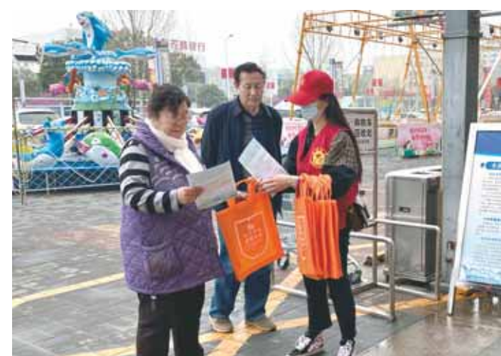
3月26日,市淇滨污水处理有限责任公司志愿者向市民发放节水、护水宣传页和宣传手袋。

3月22日是第二十九届世界水日,3月22日至3月28日是第三十四届中国水周。水利部确定我国纪念2021年世界水日和