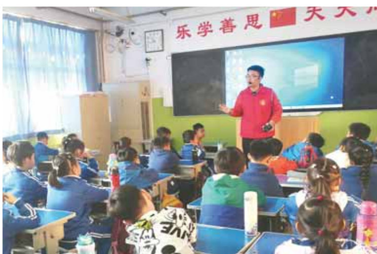
3月23日,市淇滨污水处理有限责任公司讲解员走进淇滨小学,向孩子们宣传节水知识。