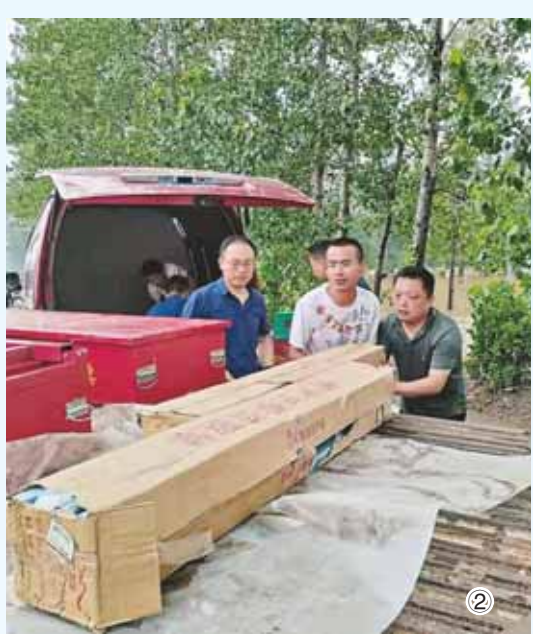
服务中心开展线上线下心理援助工作,组织人员到鹤壁黎阳中学受灾群众集中安置点开展心理援助志愿服务;山城区无疆公益救援协会组织46名经过防汛应急救援技能培训的志愿者,出动5艘冲锋舟,参与特大暴雨巡防、疏导、清淤及护送群众撤离等抢险任务,累计转移被困群众1500人。

市民政局指导慈善组织依法依规开展捐赠、受赠活动,确保慈善捐赠款物全部及时用于灾情救助。截至目前,市慈善总会、浚县慈善会、鹤山区慈善会、淇县慈善会4家慈善组织已在全国慈善信息公开平台备案公开募捐活动。截至8月1日,市慈善总会共收到各类救灾资金6678余万元,下拨4200余万元,共收到248万余件物资,已全部下拨。