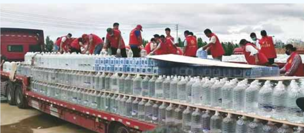
7月29日,市市场监管局的志愿者将筹集的爱心物资送到迁安群众集中安置点。

织把防汛救灾工作作为当前头等大事来抓,在防汛救灾主战场上充分发挥政治优势、组织优势,一切工作到党支部、一切工作靠党支部,冲在前、做表率,不折不扣贯彻落实市委决策部署,坚决做到守土有责、守土担责、守土尽责,群策群力构建防汛救灾严密防线,市直系统714个党支部尽锐出战、攻坚克难,团结带领广大党员干部和群众积极开展抢险救灾工作,做好