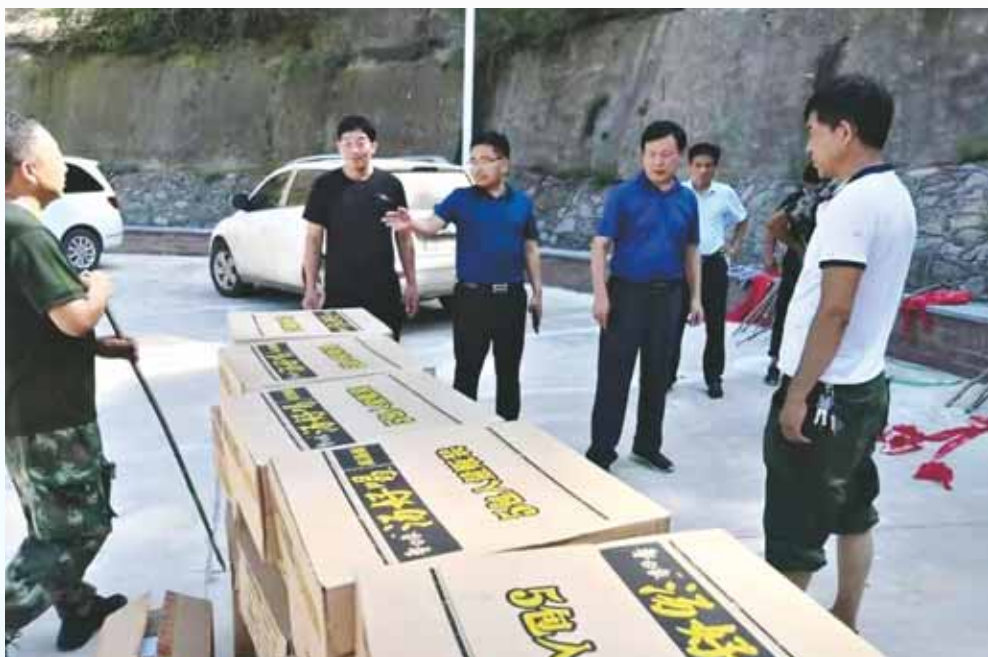
7月26日,市委直属机关工委人员到淇滨区大河涧乡杨寨沟村走访慰问受灾群众。