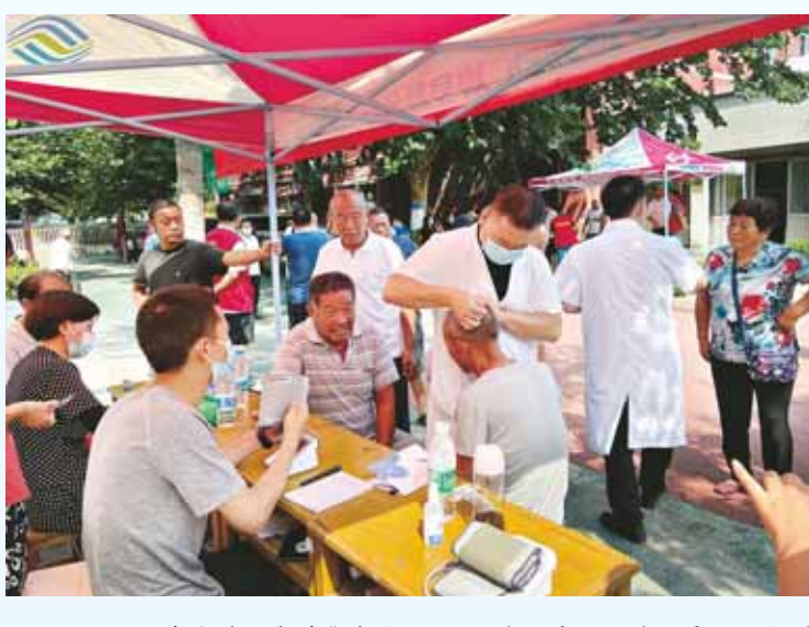
7月30日,在市淇滨中学集中安置点,医疗保障组工作人员为迁安群众做针灸治疗。

网络等渠道积极宣传防汛措施,引导广大群众注意生命财产安全,积极宣传主流媒体消息,不造谣、不信谣、不传谣。结合党史学习教育“情暖百姓·我为群众办实事”实践活动,及时发现挖掘表现突出的基层党组织和优秀党员事迹,在《鹤壁日报》开设的《百年党史悟初心、机关力行做表率》专栏进行宣传报道,形成学先进、比先进、争当先进的良好氛围。同时,依托“学习强国”平台、鹤壁机关党建微信平台、市直机关党建微信公众号、鹤壁机关党建网,宣传推介市直机关党员干部群众防汛救灾风采,激励全市党员干部以实际行动践行初心使命。截至目前,已在“学习强国”平台推送稿件39篇,在《鹤壁日报》刊发稿件31篇,在市直机关党建微信公众号发布稿件19期48篇、在省直机关党建网发布稿件6条。