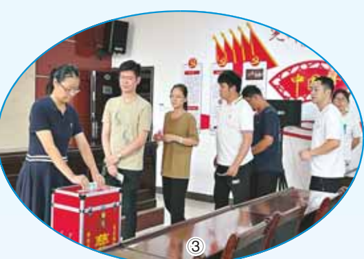
图①:7月29日,市民政局的志愿者将山东省潍坊市爱心人士公益服务中心捐赠的雨靴、被子、酒精等救灾物资和青州市青城义工公益服务中心捐赠的消毒液、蚊帐等救灾物资送到浚县卫贤镇一中集中安置点。

市民政局向全市广大社会组织发出倡议,号召社会组织要强化责任担当,积极投身防汛救灾工作,加强行业引导和指