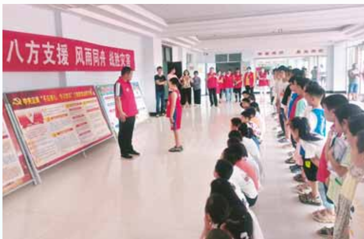
7月30日,市淇滨小学党员突击队队员在鹤壁能源化工职业学院集中安置点,为孩子们上安全教育课。