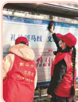
2月23日,淇滨区嵩山小学开展了“走近国防教育、志愿服务进社区”主题实践活动。当天,教师带领学生参观了国防主题公园,随后到怡乐园社区开展了清洁家园活动。