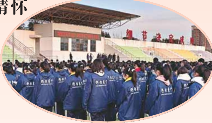
鹤壁高中利用升旗仪式对学生进行爱国主义教育。

本报讯 (记者 秦颖)2月21日7时30分,在激昂的国歌声中,鲜艳的五星红旗在鹤壁高中冉冉升起,迎着朝阳飘扬在校园上空。当日,鹤壁高中全体师生举行了以“学冬奥精神,一起向未来”为主题的春季学期首次升旗仪式。当日,学生代表进行国旗下演讲,表示从冬奥会运动员和中国女足的身上学到了低谷时不气馁、巅峰时不骄傲的顽强拼搏精神,在今后的人生道路上将积极迎接挫折和挑战,做最好的自己,创造美好的明天。