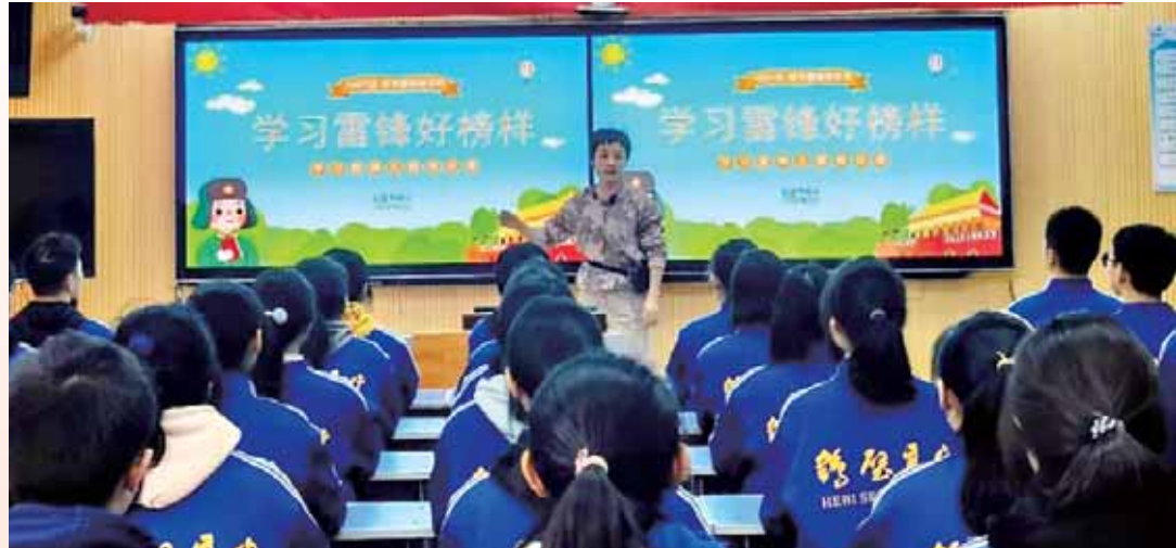
为深入拓展“扣好人生第一粒扣子”主题教育实践活动,践行社会主义核心价值观,激励新时代青年敢于担当、无私奉献,鹤壁高中校团委日前组织学生开展“学雷锋童谣传唱”主题教育活动,让雷锋精神深入人心。

垃圾,清洁无烟园党建宣传展示栏、护栏,浇灌绿地等方式,用实际行动保护环境,在奉献社会、服务他人、爱护环境、团结集体的行动中践行雷锋精神。