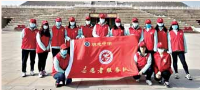
3月5日,示范区明志中学的女教师志愿者在淇河沿岸开展了“庆祝三八展风采,幸福与健康同行”徒步走“畅游品质生活,爱护美丽淇河”志愿服务活动。