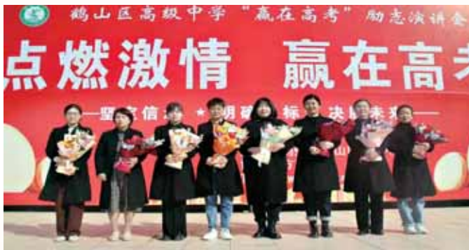
为丰富学校女教职工的业余文化生活,增强女教职工的集体凝聚力,3月8日,鹤山高中开展了女教职工表彰和趣味运动会等系列庆祝活动。

与了各个活动。大家团结协作、相互配合,校园操场上处处欢声笑语。趣味游戏在教师们此起彼伏的欢笑声中结束。该活动既让女教职工锻炼了身体,又丰富了女教职工的校园生活,使她们在紧张的教学之余放松了身心。