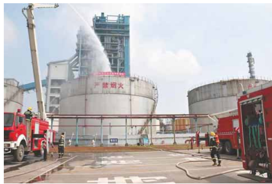
市危化品处置应急演练现场,消防救援队员模拟处置危险化学品泄漏着火事故。