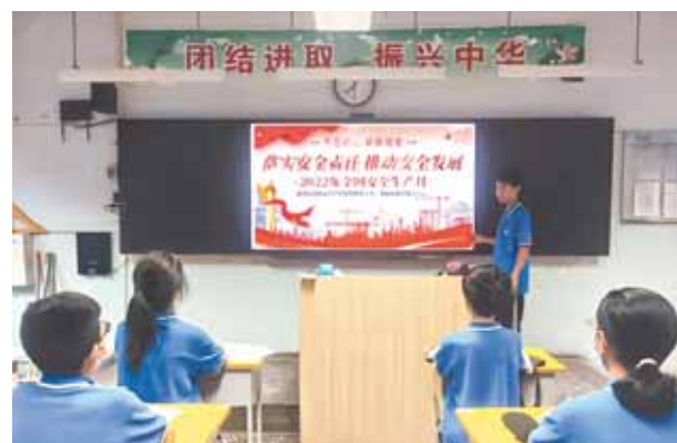
市实验学校利用班会时间开展安全生产月知识普及活动。