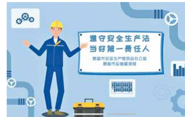
市安委会办公室、市应急管理局推出安全生产月动漫短视频,宣传新修订的安全生产法。