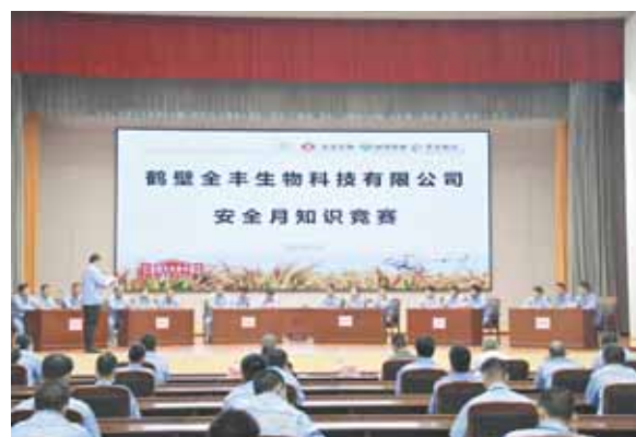
鹤山区危化生产企业组织开展安全生产知识竞赛。

随着安全宣传教育活动的持续开展,越来越多党员干部和人民群众的安全意识素养得到提升,许多人主动参与城市安全文化建设,共同谱写安全宣传教育这篇“大文章”。