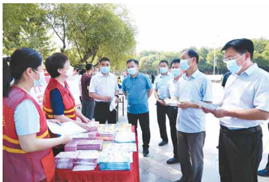
市政府办、市应急管理局有关负责人在“安全生产宣传咨询日”活动现场了解活动开展情况。

消除安全隐患,筑牢安全防线。今年6月是第21个全国安全生产月,全市上下积极响应市安委会办公室的动员部署,紧紧围绕“遵守安全生产法,当好第一责任人”这一主题,结合党史学习教育和自身工作实际,组织开展了一系列形式多样、内涵丰富、效果显著的宣传与活动,在全社会形成了人人关心、支持、参与安全生产的良好氛围。