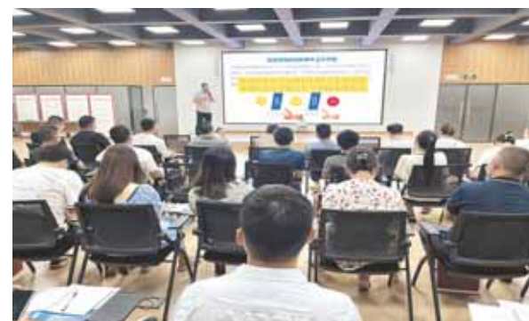
市住建局组织开展系统双预防安全工作机制培训活动。

以案说法,长鸣安全警钟。安全生产月期间,市安委会办公室组织各县区、各成员单位在单位内部集中观看学习《生命重于泰山——学习习近平总书记关于安全生产重要论述》电视专题片;印制《安全生产应知应会手册》《典型安全事故案例汇编》《防灾减灾科普应急自救手册》,通过组织集中学习、案例分析研判等形式进行深入学习,进一步强化了安全生产警示教育;组织企业从业人员集中观看事故和灾害警示教育片,讲述事故实例、剖析事故原因、交流感受体会,进一步增强广大职工的安全意识,培养大家的安全行为习惯。