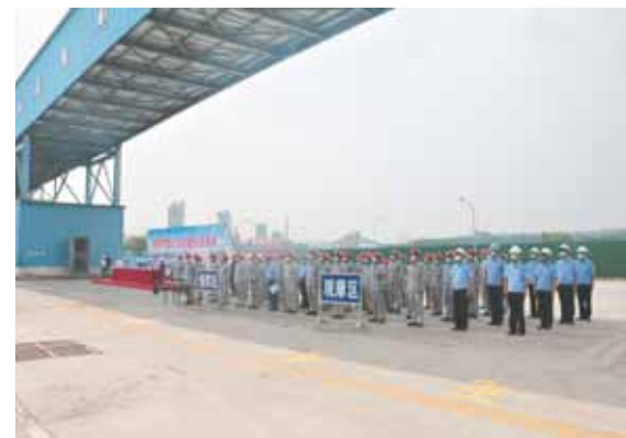
市危化品处置应急演练活动在宝山经济技术开发区举行,50余人参与演练。

市应急管理局党委书记、局长李树宽表示:“关心安全生产,参与安全发展。我市将总结安全生产月经验,进一步发挥媒体舆论宣传和引导作用,丰富安全生产宣传手段,广泛宣传安全知识,推进安全文化建设,把宣传贯彻新修订的安全生产法及推动落实第一责任人与安全生产各项重点工作相结合,强化人民群众安全意识,促进全市安全生产水平和安全生产形势持续稳定向好,以优异成绩迎接党的二十大胜利召开!”