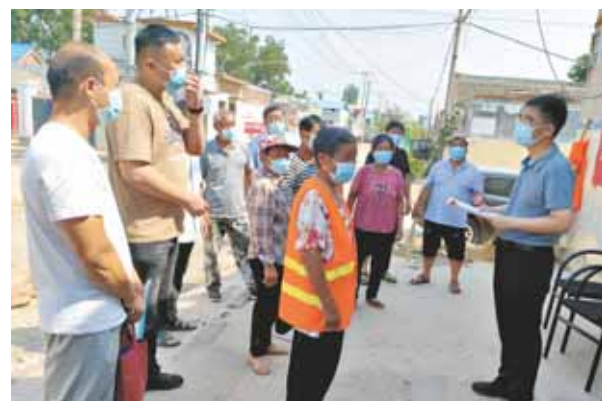
鹤壁经济技术开发区应急管理局开展安全生产知识进农村活动。

像“安全生产宣传咨询日”这一天一样,整个6月,我市持续深入基层、面向群众开展一系列精彩活动:一是深入学习贯彻习近平总书记关于安全生产重要论述精神,推动贯彻落实安全生产各项决策部署;二是以推动“第一责任人”知法明责、守法履责为重点,深入宣传贯彻安全生产法;三是创新宣传方式方法,分层分级举行安全生产月启动仪式和“宣传咨询日”活动;四是开展安全宣传“五进”活动,增强公民安全意识和素养;五是开展以案为鉴警钟长鸣活动,强化安全生产警示教育和应急演练。