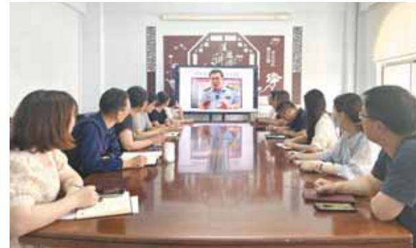
市科技局开展消防安全知识线上培训。