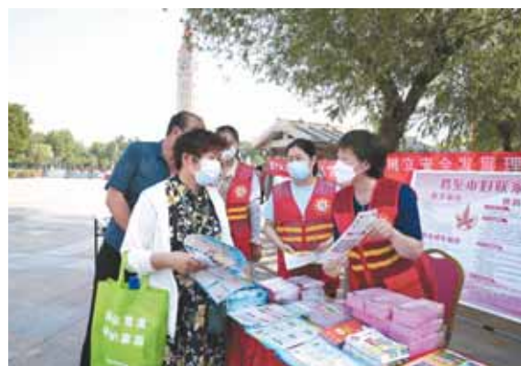
市妇联志愿者在新世纪广场向市民宣传安全生产知识。